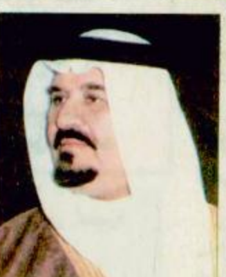
سمو النائب الثاني يستقبل امين مجلس الوزراء الصيني جدة - و.اس:

سرايفو - لندن - موسكو - دبي - القاهرة - الوكالات: تتواصل المساعي الغربية لانجاح مبادرتين امريكيتين روسية على الازمة في البلقان في وقت تواصل فيه القتال وسجل فيه جيش البوسنة تقدما ملحوظا.. وتتواصل كذلك تبادل القصف بين الكروات والصرب قرب دور وفينك. وعلى صعيد اخر وفي اطار هذه المساعي عقد الجانبان الأمريكي والروسي اجتماعا الاثنين في منتجع سوتشي المطل على البحر الأسود حيث اعلن كوزيف عن تقارب موقفي موسكو وواشنطن حول عقد قمة حول يوغسلافيا السابقة ولكنها اختلفا حول رفع العقوبات المقررة على بلجراد. ومن جانبها تبادل مسكو مساعي لاجراء محادثات مباشرة بين رؤساء جمهوريات البوسنة وكرواتيا والصرب في اعقاب فشلها في ترتيب لقاء بين رئيسي