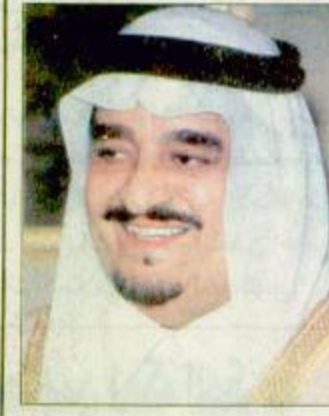
خادم الحرمين يهنئ رئيسي الهند وكوريا جدة - و.اس:

جدة - و.اس: بعث خادم الحرمين الشريفين الملك فهد بن عبدالعزيز آل سعود ببرقية تهنئة للرئيس الدكتور شانكار داهال شارما رئيس جمهورية الهند بمناسبة ذكرى استقلال بلاده. وقد اعرب خادم الحرمين الشريفين باسم شعب وحكومة المملكة العربية السعودية وباسم شخصيا حفظه الله عن اطيب التهاني وأصدق التمنيات بدموم الصحة والسعادة للرئيس شانكار داهال