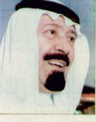
جدة - و.اس: أعلن صاحب السمو الملكي الامير عبدالله بن عبدالعزيز ولي العهد نائب رئيس مجلس الوزراء رئيس الحرس الوطني ان مساعداً للملكة العربية السعودية لشعب البوسنة والهرسك لن يتوقف عند حمله خادم الحرمين الشريفين الملك فهد بن عبدالعزيز - حفظه الله - للتضامن مع شعب البوسنة والهرسك التي نفذت يوم الجمعة الماضي بالتعاون مع الهيئة العليا لجمع التبرعات لسلمي البوسنة والهرسك برئاسة صاحب السمو الملكي الامير سلمان بن عبدالعزيز امير منطقة الرياض بل ان الملكة سيزيل ما تستطيع من جهود في مساعدة شعب البوسنة والهرسك ان شاء الله. جاء ذلك خلال الجلسة التي عقدها مجلس الوزراء برئاسة صاحب السمو الملكي الامير عبدالله بن عبدالعزيز ولي العهد ونائب رئيس مجلس الوزراء

الهداية باصحاب السمو والمعالي الوزراء الجدد ودعا لهم بالتوفيق لخدمة دينهم وليكفهم ووطنهم وشكر سموه اصحاب المعالي الوزراء السابقين على ما قاموا به من جهود في خدمة بلادهم. وأشار سموه الكريم الى الترحيب العربي والدولي بتشكيل الوزارة وقال سموه امسال الله ان يجعل في هذا التشكيل الخير للوطن والمواطنين. وقال معالي وزير الاعلان عن المجلس استعرض خلال الجلسة ابرز المستجدات على الساحتين العربية والاسلامية والدولية لاسيما ما يجري في جمهورية البوسنة والهرسك التي تعرض سكانها المسلمون لابع الحراقم التي عرفتها الانسانية على مر التاريخ بالإضافة الى الوضع في المنطقة العربية والوضع في افغانستان.