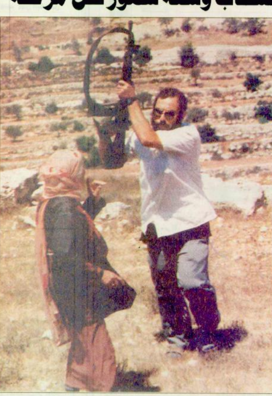
دورا القور - الضفة الغربية المحتلة: مستوطن يهودي يهزم امرأة فلسطينية وقد اطلق المستوطن النار على المظاہرين الفلسطينيين الذين قاموا بإحراق خيمة نصها المستوطن فوق قمة التل بالقرب من قرية دور القور الغربية