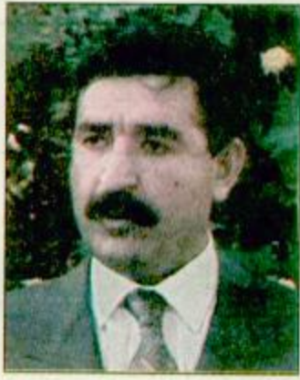
الملك حسين: عصر جديد للعراق القدس المحتلة

عرب العادل الاردني الملك حسين عن امه في ان يؤدي فرار الفريق حسين كامل حسن صهر الرئيس العراقي صدام حسين الى فتح وعصر جديد للعراق. البقية (ص: ١٩)