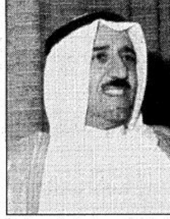
الجماعي في مختلف المجالات سياسياً واقتصادياً وأميناً. وحول منظور دول المجلس تجاه القضايا الدولية قال معاليه، لقد اكتسبت

وأقتصادياً كما قدم المجلس جهوداً ومساهمات لخدمة الانسانية في شتى بقاع العالم وساهم في مجهودات الأمم المتحدة لرساء عالم الأمن والاستقرار والسلام في العالم. وعن نظرة العالم الخارجي لدور مجلس التعاون الخليجي اقليمياً ودولياً وبالذات تجاه القضايا القائمة والمستجدة على الصعيد كافة قال معالي الشيخ صباح الاحمد الصباح: لقد ثبت المجلس وبشهادة جميع اللراقبين السياسيين والناخبين مسيرة المجلس قدرته على العمل وبنوع جماعية تجاه كل القضايا التي مرت بالسلطة ويكفيها فخراً أن تجربة المجلس في التجربة الوحيدة التي استطاعت تجاوز العديد من التحديات والمصاعب التي صفت بالخطوة ورسدت نموذجاً راسخاً من العمل التعاوني