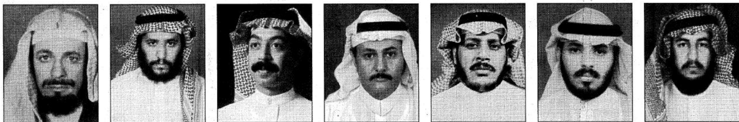
عز عدد من المواطنين عن سعادتهم بزيارة صاحب السمو الملكي الأمير عبدالله بن عبدالعزيز ولي العهد ونائب رئيس مجلس الوزراء ورئيس الحرس الوطني محافظة الطائف والتي يتفقد من خلالها المحافظة ويتلمس احتياجات المواطنين والعمل على تأمينها، كما يقوم بتدشين بعض المشاريع التنموية واكدوا لـ «الجزيرة» ان هذه الزيارة ليست غريبة على سموه الكريم في اطار اهتمامه بدعم انطلاقه النهضة التطويرية الشاملة بالمحافظة وجميع مناطق ومحافظات للملكة.