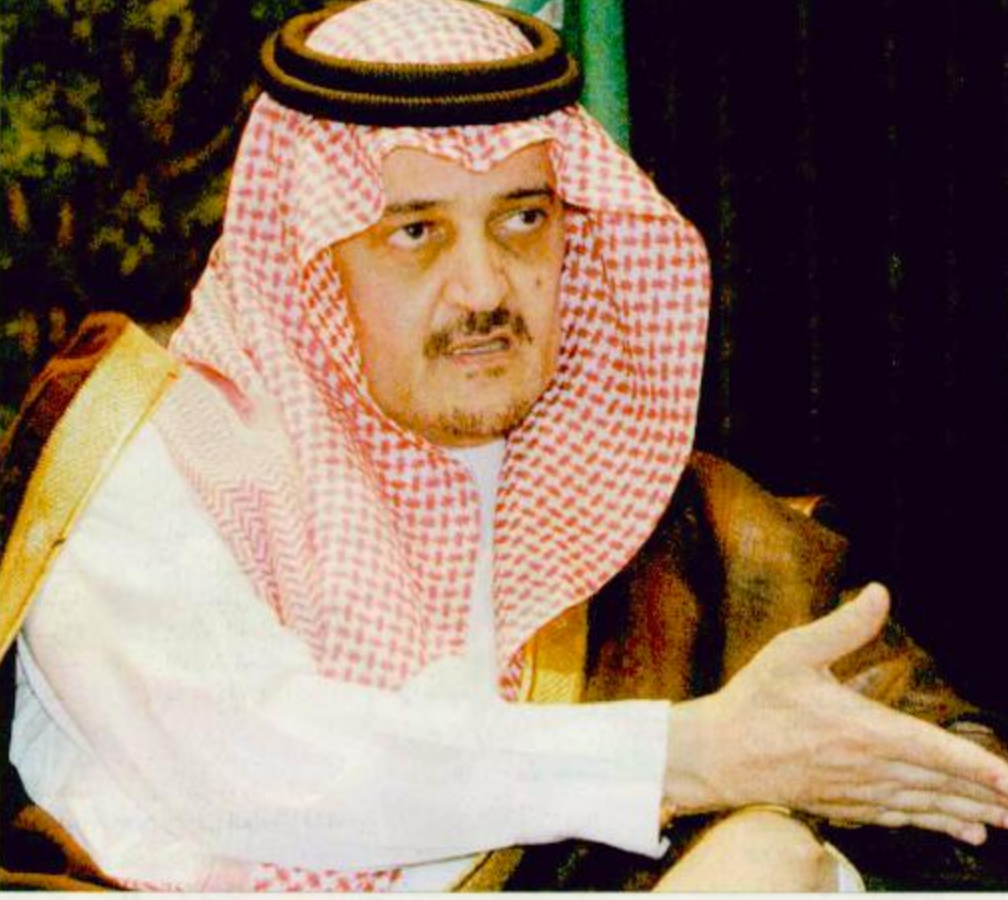
الأمير سعود الفيصل يتحدث لمحطات التلفزة الدولية

أوضح صاحب السمو الملكي الأمير سعود الفيصل وزير الخارجية أن لقاء صاحب السمو الملكي الأمير عبدالله بن عبدالعزيز ولي العهد نائب رئيس مجلس الوزراء ورئيس الحرس الوطني مع فخامة الرئيس الأمريكي جورج دبليو بوش سيتناول موضوع الساعة وهو موضوع الاحتلال الإسرائيلي للأراضي الفلسطينية لافتاً النظر إلى النتائج المتوخاة لافتاً النظر ومنها أن يكون هناك انسحاب للقوات الإسرائيلية وإزالة الحصار عن الرئيس الفلسطيني ياسر عرفات وقال حتى نستطيع العودة إلى طريق السلام الذي كنا نأمل فيه.