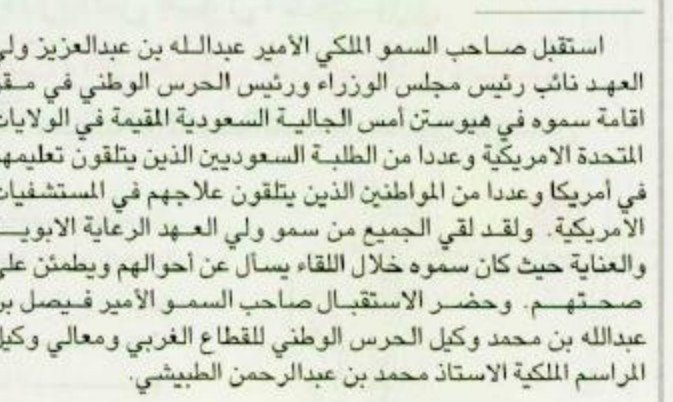
ولي العهد استقبال الجالية السعودية المقيمة في أمريكا

استقبل صاحب السمو الملكي الأمير عبدالله بن عبدالعزيز ولي العهد نائب رئيس مجلس الوزراء ورئيس الحرس الوطني في مقر إقامة سموه في هيوستن أمس الجالية السعودية المقيمة في الولايات المتحدة الأمريكية وعدداً من الطلبة السعوديين الذين يتلقون تعليمهم في أمريكا وعدداً من المواطنين الذين يتلقون علاجهم في المستشفيات الأمريكية. ولقد لقي الجميع من سمو ولي العهد الرعاية الأبوية والعناية حيث كان سموه خلال اللقاء يسأل عن أحوالهم ويطمئن على صحتهم. وحضر الاستقبال صاحب السمو الأمير فيصل بن عبدالله بن محمد وكيل الحرس الوطني للقطاع الغربي ومعالي وكيل المراسم الملكية الأستاذ محمد بن عبدالرحمن الطيبيشي.