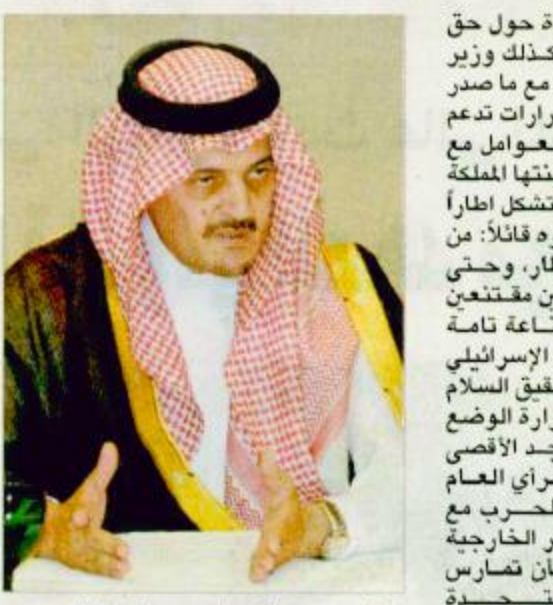
الأمير سعود الفيصل يتحدث لرؤساء التحرير

قال صاحب السمو الملكي الأمير سعود الفيصل وزير الخارجية السعودية أن العلاقات القديمة بين هذه العلاقات وعبر سنين طويلة واجهت مشكلات كثيرة أمكن التغلب عليها بالصراحة بين الأصدقاء. وأضاف سموه أن المهم أن يعرف الجميع بأن القاديين سمو الأمير عبدالله وفضامة الرئيس بوش لا يناوران في سياستهما وأن مباحثات اليوم التي ستجري بينهما ستتم بالصراحة والوضوح وأن مثل هذه العوامل سوف تساهم في تحقيق المصلحة للبدين.