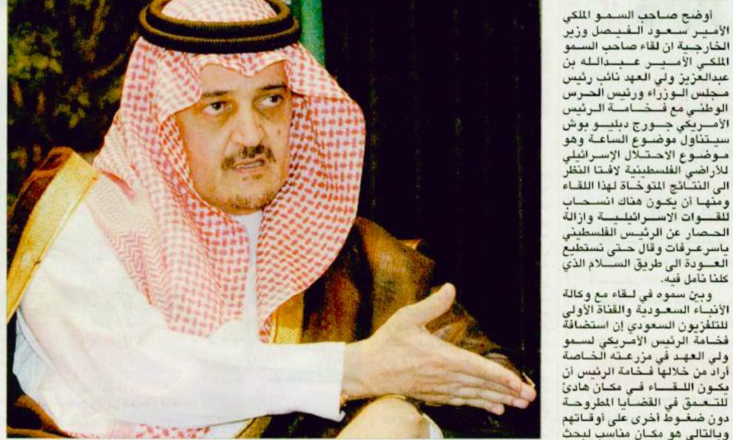
الأمير سعود الفيصل يتحدث لمحطات التلفزة الدولية

بين المملكة العربية السعودية والولايات المتحدة الأمريكية مبحثاً من شأنه أن يفتح آفاقاً جديدة للتعاون بين البلدين في مختلف المجالات. وقال سموه في حديثه لوسائل الإعلام: «إننا نرى في هذا اللقاء فرصة مهمة للتعاون بين البلدين في مختلف المجالات، وخاصة في مجال الأمن والاستقرار والتنمية الاقتصادية». وأضاف سموه: «نحن نرى في هذا اللقاء فرصة مهمة للتعاون بين البلدين في مختلف المجالات، وخاصة في مجال الأمن والاستقرار والتنمية الاقتصادية». وأضاف سموه: «نحن نرى في هذا اللقاء فرصة مهمة للتعاون بين البلدين في مختلف المجالات، وخاصة في مجال الأمن والاستقرار والتنمية الاقتصادية».