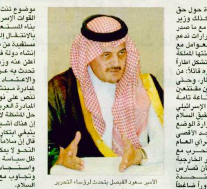
الأمير سعود الفيصل يتحدث لرؤساء التحرير

موضوع تنت وميتشل ولكن عندما تنسحب القوات الإسرائيلية وتوقف حكومة شارون وبناء المستعمرات وتبدي استعدادها بالانتقال إلى مفاوضات الحل النهائي مستفيدة من طروحات الرئيس الأمريكي في إنشاء دولة فلسطينية وفق التصور الذي أعرضه وزير الخارجية الأمريكية وما تحدث به عن كيفية العمل في هذا الإطار والاعتماد على بعض الجوانب المهمة لمبادرة ميتشل وفرات مجلس الأمن التي تنص على نواح مختلفة ومنها ضمنها المبادرة الأمريكية التي اقترحتها المملكة، فإن حل المشكلة لا يحتاج إلى أكثر من ذلك، أي حل هناك أشياء جاهزة للحل ومن ثم فلا ينبغي ابتكار أفكار جديدة، غير أن سموه قال إن سلاماً عادلاً لا يمكن تحقيقه على هذا النحو إلا يمكن أن يتحقق وأنه معزوم في ظل سياسة شارون إلا إذا تغيرت عقلية واستجاب الموقف وتجاوب مع مبادرات السلام.