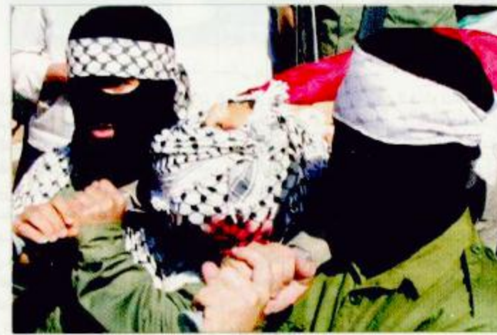
تشييع جنازة الشهيد الفتي الفلسطيني

أعلن رئيس فريق المفتشين الدوليين هانز بليكس تأييده في واشنطن تبنتي مجلس الأمن قراراً جديداً حول نزع السلاح العراقي، لكنه لم يكشف ما إذا كان سيتضمن احتمال اللجوء إلى القوة. وقال بليكس لدى خروجه من محادثات مع مسؤولين أمريكيين كبار في واشنطن إن «مثل هذا القرار سيكون مفيداً، وإن عدداً متزايداً من أعضاء مجلس الأمن يصلون إلى هذا الاستنتاج». وأضاف أن ذلك يمكن أن «يوضح» مهته. لكن بليكس كان متحفظاً حول الشكل الذي يمكن أن يتخذه القرار الجديد ولم يدخل في النقاش الذي يلزم مجلس الأمن لمعرفة ما إذا كان هذا القرار سيتضمن احتمال اللجوء إلى القوة ضد العراق. أو ما إذا كان هذا التفسير المثير للجدل لسيرد في قرار لاحق. وقال «أترك لمجلس الأمن مهمة الصياغة الدقيقة عبر قرار واحد أو اثنين». وطلبت واشنطن من تركيا رسمياً السماح لها باستعمال قواعدها الجوية لشن عملية عسكرية محتملة ضد العراق. وعلى الصعيد نفسه ذكرت مصادر عسكرية اسرائيلية أن بطاريات صواريخ مضادة للصواريخ من طراز باتريوت ستصل قريباً إلى اسرائيل من الولايات المتحدة ضمن الاستعدادات الخاصة لضرب العراق. وذكر راديو لندن في تقرير إخباري أن هاتين البطاريتين تنضمان إلى أخريات سبق ونصبت في مواقع استراتيجية اسرائيلية مثل المعامل الذرية في ديمونة ومطار تل أبيب وأماكن حساسة أخرى. طالع «ص» ١٦