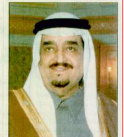
○ سمو ولي العهد استقبل سفير ألبانيا

القاهرة - مكتب الجزيرة - واس بعث خادم الحرمين الشريفين الملك فهد بن عبد العزيز رسالة إلى فخامة الرئيس محمد حسني مبارك رئيس جمهورية مصر العربية وزدا على رسالة فخامته التي نقلها معالي وزير خارجية مصر عند زيارته للمملكة مؤرخاً. كما بعث صاحب السمو الملكي الأمير عبد الله بن عبد العزيز ولي العهد ونائب رئيس مجلس الوزراء ورئيس الحرس الوطني رسالة إلى فخامة الرئيس محمد حسني مبارك وقام بنقل الرسالتين صاحب السمو الملكي الأمير سعود الفيصل وزير الخارجية خلال لقائه بفخامة الرئيس مبارك أمس. وأبلغ سمو وزير الخارجية الصحفيين عقب اللقاء بان الدول العربية ترحب بعقد القمة العربية خاصة إذا كانت هذه القمة لدعم عملية السلام والوقوف بصلاية لدعم هذه العملية. البغية، ص ٢٣.