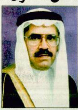
○ سمو ولي العهد استقبل سفير ألبانيا