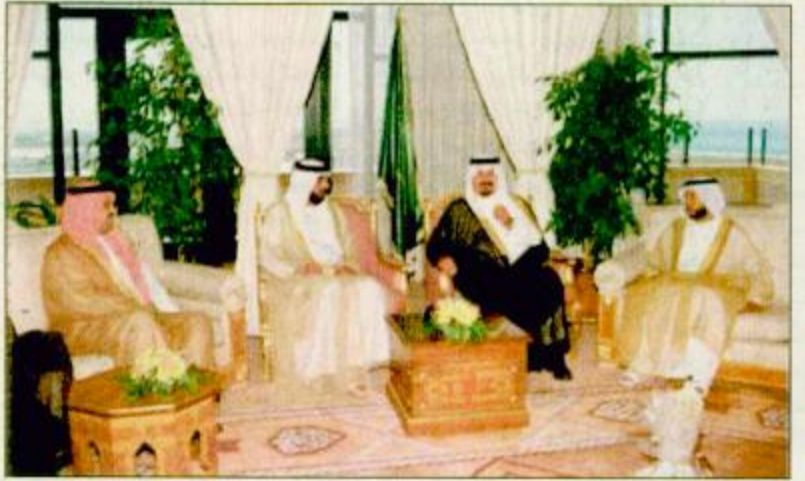
○ سمو الأمير سلطان استقبل ولي عهد أبوظبي

دبي / ابوظبي: واس وصل صاحب السمو الملكي الأمير سلطان بن عبدالعزيز النائب الثاني لرئيس مجلس الوزراء ووزير الدفاع والطيران والمفتش العام والوفد المرافق لسموه إلى دبي عصر أمس عن طريق البر قادماً من أبوظبي في إطار زيارة سموه لدولة الإمارات العربية المتحدة. ويضم الوفد المرافق لسموه صاحب السمو الملكي الفريق أول مقاعد خالد بن سلطان بن عبدالعزيز وصاحب السمو الأمير فيصل بن سعود بن محمد آل سعود البغية، ص ٢٢.