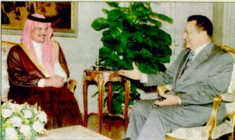
○ الرئيس مبارك في حديث ودي مع الأمير سعود الفيصل أثناء اجتماعهما أمس بالقاهرة

القاهرة - مكتب الجزيرة - واس بعث خادم الحرمين الشريفين الملك فهد بن عبد العزيز رسالة إلى فخامة الرئيس محمد حسني مبارك رئيس جمهورية مصر العربية وزدا على رسالة فخامته التي نقلها معالي وزير خارجية مصر عند زيارته للمملكة مؤرخاً. كما بعث صاحب السمو الملكي الأمير عبد الله بن عبد العزيز ولي العهد ونائب رئيس مجلس الوزراء ورئيس الحرس الوطني رسالة إلى فخامة الرئيس محمد حسني مبارك وقام بنقل الرسالتين صاحب السمو الملكي الأمير سعود الفيصل وزير الخارجية خلال لقائه بفخامة الرئيس مبارك أمس. وأبلغ سمو وزير الخارجية الصحفيين عقب اللقاء بان الدول العربية ترحب بعقد القمة العربية خاصة إذا كانت هذه القمة لدعم عملية السلام والوقوف بصلاية لدعم هذه العملية. البغية، ص ٢٣.