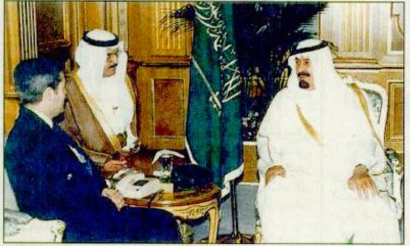
○ سمو ولي العهد استقبل سفير ألبانيا

جدة - واس استقبل صاحب السمو الملكي الأمير عبد الله بن عبد العزيز ولي العهد ونائب رئيس مجلس الوزراء ورئيس الحرس الوطني بمكتب سموه بالديوان الملكي بقصر السلام أمس سفير جمهورية ألبانيا لدى المملكة فانتير ماثرو. كما استقبل صاحب السمو الملكي الأمير عبد الله بن عبد العزيز ولي العهد ونائب رئيس مجلس الوزراء ورئيس الحرس الوطني بمكتب سموه بالديوان الملكي بقصر السلام أمس سفير جمهورية ألبانيا لدى المملكة فانتير ماثرو. ص ٢٣.