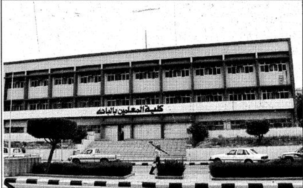
ويبلغ عدد الطلاب الدارسين ٧٢٠ طالباً للعام نفسه وتجري الدراسة في مستويات دراسية أما أقسام الكلية فهي قسم الدراسات القرآنية وقسم الكلية على نظام السنوات حيث يتخرج الطلاب بعد أن ينهي أربع

انطلاقاً من حرص حكومة مولاي خادم الحرمين الشريفين على نشر العلم في مختلف مناطق المملكة وتسجيل مهمة الدراسة وتحصيل العلم لجميع أبناء هذا الوطن المعطاء فقد انشئت كلية المعلمين في الباحة في ١٤٠٩/٧/١ هـ ضمن ثلاث كليات أخرى اعتمدت انشائها في كل من الباحة وعمر وجدة وذلك بهدف إعداد معلمين أكفاء للعمل بالمرحلة الابتدائية بما يتناسب مع حاجات المجتمع ومتطلباته ورفع مستوى تأهيل المعلمين القدامى وتجديد معلوماتهم ومفاهيمهم التربوية. وبدأت الكلية بالباحة بأحد عشر عضواً واستقبلت الكلية نافتها الأولى طالباً وتخرجت أول دفعة عام ١٤١٢ هـ واليوم وبنهاية عام ١٤١٨ هـ بلغ عدد خريجي هذه الكلية ٧٢٨ خريجاً