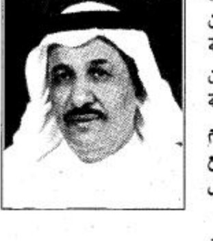
عبر سفير دولة البحرين لدى المملكة خالد بن محمد المسلم عن عمق العلاقات التاريخية العربية التي تربط دولة البحرين وشقيقتها المملكة وخصوصيتها التي حتمت قيام تعاون وثيق بينهما في جميع المجالات وكافة الاصعدة وقال في حديث خاص له «الجزيرة» لا يفوتني في هذا المقام ان

انتزه مناسبة تزامن هذا الحديث مع صحيفتكم الغراء ومناسبة اليوم الوطني للمملكة العربية السعودية الشقيقة لارفع الى مقام خادم الحرمين الشريفين الملك فهد بن عبدالعزيز ملك المملكة وولي عهده الامين وحكومته الرشيدة والشعب السعودي الشقيق باسمي آيات التهاني والتبريكات بهذه المناسبة العظيمة علينا جميعا لتأسيس المملكة العربية السعودية وتوحيدها من أهمية في تاريخ هذه المنطقة وتعزيز أمنها واستقرارها.