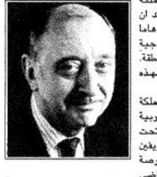
السفير الألماني لدى المملكة الدكتور وودولت رابطة، اكد ان المملكة تلعب دورا رئيسيا في المنطقة الخارجية جدا في سياستها الخارجية.

السفير الألماني لدى المملكة الدكتور وودولت رابطة، اكد ان المملكة تلعب دورا رئيسيا في المنطقة الخارجية جدا في سياستها الخارجية. وكثيرا ما عمل استقرار في المنطقة. وقال في تصريح بهذه المناسبة: يتيح اليوم الوطني للمملكة سواء لشعب المملكة العربية السعودية او لحكومته تحت قيادة خادم الحرمين الشريفين السعوديين، فرصة قيمة للتأمل في احداث الماضي وللآفاق نظرة الى افق المستقبل. واضافت ان التطور الاقتصادي في العقود الماضية للمملكة من الأمور المذهلة للغاية كما ان يتمتع بكل التقدير من قبل الجميع، وتم عملية البناء