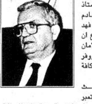
السفير السوري لدى المملكة السيد عمر السيد اكد ان خادم الحرمين الشريفين الملك فهد بن عبدالعزيز استطاع ان يقود المملكة العربية السعودية الى بر الامان رغم الصعوبات الجمة ووفر لها امكانيات التطور في كافة المجالات الاقتصادية والاجتماعية والدستورية.

منذ ايام الاسلام الاولى، وتشاء ارادة الله ان يكمل نعمته على هذه البلاد بمتمحها نمعا كثيرة لتزيد في توطيد اركانها وازدهارها. وتعاقب بعد ذلك ابناء الملك عبدالعزيز على قيادة هذه البلاد وكان دور خادم الحرمين الشريفين الملك فهد بن عبدالعزيز -رحمه الله- وما يزال بارزا وحاسما في قيادته الشجاعة لبلده نحو مزيد من التقدم والازدهار. لقد استطاع خادم الحرمين الشريفين الملك فهد بن عبدالعزيز ان يقود المملكة العربية السعودية الى بر الامان رغم الصعوبات الجمة ووفر لها امكانيات التطور في كافة المجالات الاقتصادية والاجتماعية والدستورية.