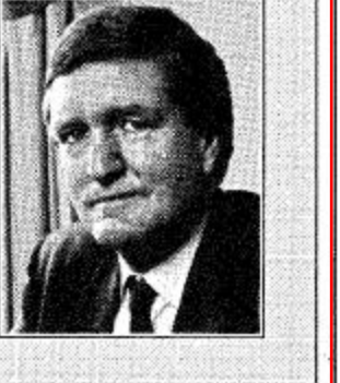
السفير البريطاني لدى المملكة الدكتور وودولت رابطة، اكد ان المملكة تلعب دورا رئيسيا في المنطقة الخارجية جدا في سياستها الخارجية.

السفير البريطاني لدى المملكة الدكتور وودولت رابطة، اكد ان المملكة تلعب دورا رئيسيا في المنطقة الخارجية جدا في سياستها الخارجية. وكثيرا ما عمل استقرار في المنطقة. وقال في تصريح بهذه المناسبة: يتيح اليوم الوطني للمملكة سواء لشعب المملكة العربية السعودية او لحكومته تحت قيادة خادم الحرمين الشريفين السعوديين، فرصة قيمة للتأمل في احداث الماضي وللآفاق نظرة الى افق المستقبل. واضافت ان التطور الاقتصادي في العقود الماضية للمملكة من الأمور المذهلة للغاية كما ان يتمتع بكل التقدير من قبل الجميع، وتم عملية البناء