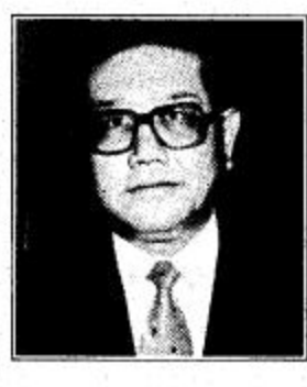
السفير الصيني لدى المملكة السيد تشنغ دا يونغ، المملكة بأنها دولة محبة للسلام تهتم بتطوير العلاقات الطيبة مع سائر بلدان العالم وتضطلع بدور هام في التنمية الاقتصادية.

المملكة دولة محبة للسلام ولها منجزات عظيمة وصف سفير الصين الشعبية لدى المملكة السيد تشنغ دا يونغ، المملكة بأنها دولة محبة للسلام تهتم بتطوير العلاقات الطيبة مع سائر بلدان العالم وتضطلع بدور هام في التنمية الاقتصادية. وأكد سفير الصين الشعبية أن المملكة دولة محبة للسلام تهتم بتطوير العلاقات الطيبة مع دول الخليج وسائر بلدان العالم وتضطلع بدور هام في التنمية الاقتصادية. وأكد سفير الصين الشعبية أن المملكة دولة محبة للسلام تهتم بتطوير العلاقات الطيبة مع دول الخليج وسائر بلدان العالم وتضطلع بدور هام في التنمية الاقتصادية. وأكد سفير الصين الشعبية أن المملكة دولة محبة للسلام تهتم بتطوير العلاقات الطيبة مع دول الخليج وسائر بلدان العالم وتضطلع بدور هام في التنمية الاقتصادية.