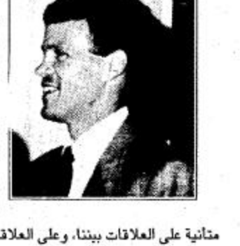
السفير كندا لدى المملكة السيد بيتر سويلاند، اكد ان خير وسعادة ورفاهية المملكة هي واحدة من الازكان الاساسية لسلام واستقرار دامت في المنطقة.

السفير كندا لدى المملكة السيد بيتر سويلاند، اكد ان خير وسعادة ورفاهية المملكة هي واحدة من الازكان الاساسية لسلام واستقرار دامت في المنطقة. وقال في ذكرى اليوم الوطني ينظر المواطنين عادة خلفهم لتاريخ بلادهم، كما انهم يتفكرون مليا في مستقبلهم بالنسبة لكندا، اليوم الوطني للمملكة العربية السعودية هو فرصة لافاء نظرة