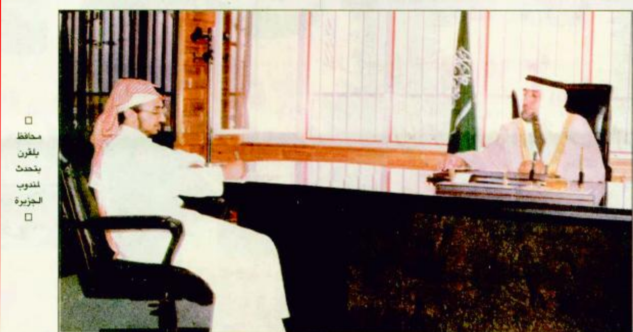
□ محافظ بلقرن يتحدث للندوة الجزيرة

بمدينة سبت العلاء عام ١٣٨٩هـ وكان اسمه آنذاك مستشفى وتم تحويله إلى مستشفى عام بسعة ٤٢ سريراً في ١/٥/١٤٠٥هـ ثم توسع المستشفى إلى أن وصل إلى مائة سرير كمستشفى عام وبه عدد من الأقسام هي (الباطنة - الجراحة العامة - النساء والولادة - العيون - المسالك البولية - الجلد والتناسلية - الأنف والأذن والحنجرة - العظام - الصدرية - الأطفال) كما يوجد قسم لكفحة نوافل الرض واليهارسيا كما أن العمل جارٍ لفتح قسم للفسيولوجيا وأخر للعلاج الطبيعي والحاجة ماسة إلى إحداث عيادة نفسية وعيادة قلب ومركز طب أسنان وقدم بناء مبنى حديث يتسع لـ ٣٠ سريراً حيث الباني الحالية قديمة ومنها بعض المباني للاستاجرة، وأضاف إلى أنه يوجد بالمحافظة عدد من الدوائر الحكومية التي تخدم المواطنين والقيمين تتمثل في الهلال الأحمر، فرع للزراعة والمياه تم إنشائه عام ١٣٨٥هـ كما يوجد بالبلد شرف فرع آخر أحدث عام ١٣٩٨هـ، فرع لإدارة الطرق الزراعية أحدث عام ١٣٩٨هـ، وحدة كهرباء العلاء افتتحت عام ١٤٠٣هـ وهي تعطي جميع قرى المحافظة، نادي الرزيتون الرياضي التابع لرعاية الشباب ويوجد به العديد من الألعاب أسس عام ١٣٩٥هـ، الدفاع المدني وافتتح أول مركز له في مدينة سبت العلاء عام ١٣٩٩هـ كما افتتحت ثلاثة مراكز أخرى في بلشوت عام ١٤٠٦هـ وفي الشبان وعفراء كما يوجد بالمحافظة إدارة للدفاع المدني افتتحت في عام ١٤١٣هـ، الضمان الاجتماعي، هيئة الأمر بالمعروف والنهي عن المنكر، الأوقاف والمساجد، البنوك متخلة في بنك الرياض والبنك الأهلي وشركة الراجحي، جمعية البر والخدمات الخيرية، البنك الزراعي، الأحوال المدنية وافتتحت عام ١٣٨٩هـ.