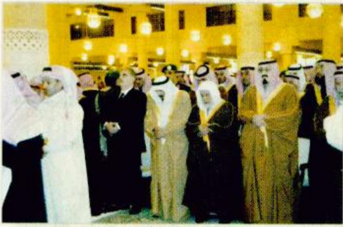
سمو ولي العهد يؤدي صلاة الميت على الأمير محمد بن خالد