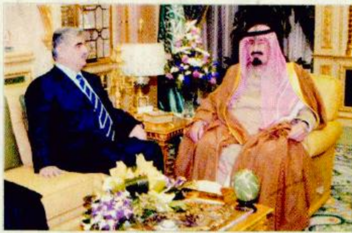
ويستقبل سموه رئيس وزراء لبنان