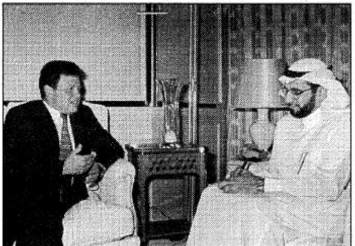
الملك حسين يغادر المستشفى خلال أيام قليلة

الملك حسين يغادر المستشفى خلال أيام قليلة كتب - سلمان العمري: أكد صاحب السمو الملكي الأمير عبدالله بن الحسين بن طلال عمق العلاقات التي تربط بين المملكة العربية السعودية والمملكة الأردنية الهاشمية مشيراً إلى أن إصرار الروابط الأخوية التي تربط بين شعبي البلدين خيرة بجزيرة في العمق. وقال سمو الأمير عبدالله بن الحسين بن طلال في تصريح لـ الجزيرة: «إن زيارته الحالية للمملكة جاءت محققة للأمل والتطلع مشيراً إلى أنه قبل خادم الحرمين الشريفين الملك فهد بن عبدالعزيز وسمو ولي عهده الأمين - حفظهما الله - ونقل لهما تحيات وأمنيات صاحب الجلالة الملك الحسين بن طلال ملك المملكة الأردنية الهاشمية وسمو نائبه ولي العهد الأمير الحسن بن طلال معبراً في الوقت نفسه عن سعادت بلقاء خادم الحرمين الشريفين وسمو ولي عهده الأمين. وأضاف سموه أن زيارته الحالية للمملكة العربية السعودية في عهد خادم الحرمين الشريفين الملك فهد بن عبدالعزيز آل سعود - رحمه الله - وما لسه من تطور وإزدهار في شتى مناحي الحياة، كما أعرب سمو الأمير عبدالله بن الحسين عن سروره وإعجابها بما يشهده من تقنية حديثة علمية، وخاصة في المؤسسات العلمية والثقافية التي قام بزيارتها