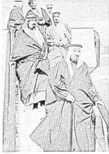
• جلالة الملك خالد يصل مطار الرياض