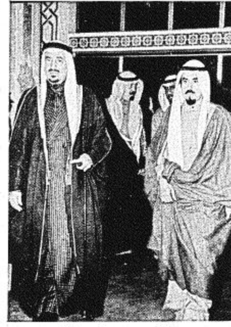
• جلالتهم مع سمو أمير الكويت