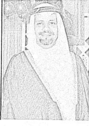
استقبل معالي الشيخ احمد زكي يماني وزير الجيول والشؤون المعديه ظهر امس السيد هاملتن فورتن احد مساعدي الرئيس الأمريكي جيمي كارتر

استقبل معالي الشيخ احمد زكي يماني وزير الجيول والشؤون المعديه ظهر امس السيد هاملتن فورتن احد مساعدي الرئيس الأمريكي جيمي كارتر وتم خلال المقابلة مناقشة بعض الموضوعات ذات الاهتمام المشترك بين البلدين وخاصة موضوع الطاقة