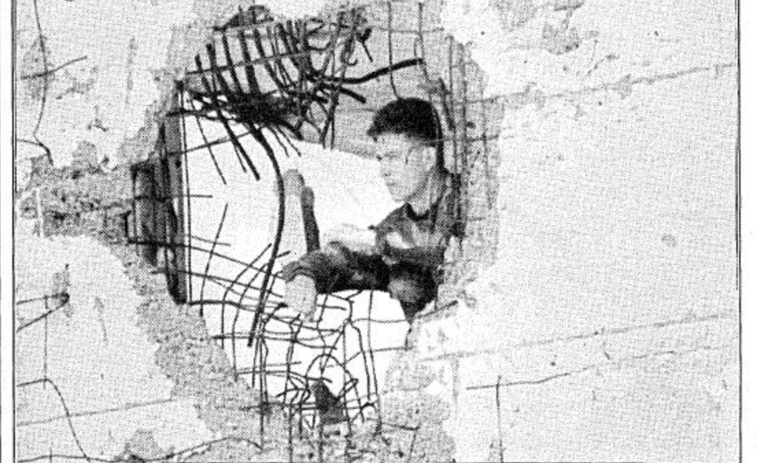
أحد عناصر الجيش البوسني الحكومي ينظر من خلال فتحة ناجمة من القصف الصربي لأحدى المدارس الثانوية بمدينة جرادانكا

كيجالي - أ.ش.أ.؛ أعلن راديو رواندا مساء أمس ان زائير قامت بتسليم جزء من الممتلكات الرواندية التي هربها مسؤولون في حكومة الهوتو السابقة الى زائير في أعقاب هزيمتها على أيدي الجبهة الوطنية الرواندية الحاكمة في شهر يوليو من عام 1994م. وذكر الراديو ان الممتلكات التي تسلمتها رواندا شملت طائرتي هليكوبتر وسيارات عسكرية وكمية من الاسلحة الخفيفة. وقد وصف السيد انستاس جاسانزا وزير خارجية رواندا التي شهدت عملية التسليم عند معبر جيبستي على الحدود مع زائير هذه العملية بأنها بداية طيبة لتنفيذ الاتفاق الثنائي الموقع بين البلدين في اطار اعلان قمة القاهرة لدول منطقة البحيرات العظمى الذي عقد في نهاية شهر نوفمبر الماضي. وأعرب جاسانزا عن أمه في ان تستكمل اجراءات تسليم باقي الممتلكات الرواندية الموجودة في زائير.. وقد أرجع المتحدث باسم الجيش الرواندي الحالة السيئة للأسلحة والعتاد التي أعيدت الى نقص الصيانة وسوء التخزين واستبعد إمكانية قيام زائير بتجديد هذه الاسلحة والعتاد مشيرا الى ان طائرتي الهليكوبتر ما زالتا تحملان العلم الرواندي.