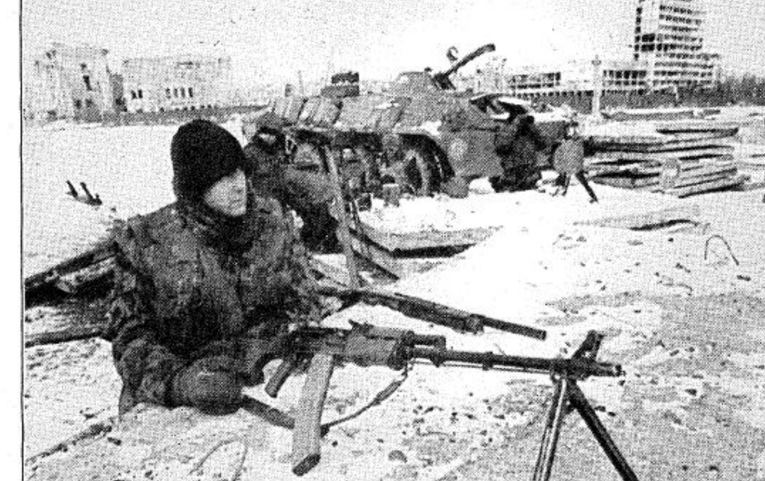
أحد عناصر الجيش البوسني الروسي يقوم بأعمال الحراسة من موقعه المجهز بمدفع ماكينة كلاشينكوف وسط مدينة جروزني