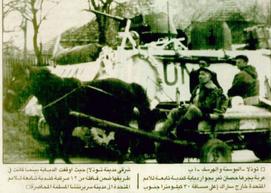
شرفي مدينة تولدالا حيث اوقفت الدبابة بينما كانت في طريقها حصان تم بجوار دبابة تابعة للامم المتحدة خارج سراك (على مسافة ٣٠ كيلومترا جنوب المتحدة الى مدينة سربرنيتشا المسلمة المحاصرة)

أصدر مجلس الأمن في ساعة مبكرة من صباح أمس الأحد قرارا يفرض عقوبات اقتصادية أكثر تشددا على دولة يوغسلافيا عقابا على الهجوم الذي شنته صرب البوسنة على بلدة سربرنيتشا المسلحة في شرق البوسنة. وجاءت نتيجة التصويت بأيد ١٣ صوتا للقرار مع امتناع روسيا والصين عن التصويت. ويرى القرار اعتبارا من ٢٦ ابريل الحالي. وكان المجلس قد أرجأ التصويت على القرار يوم الاثنين الماضي نظيبا لطلب روسيا بتأجيل فرض العقوبات حتى يوم ٢٦ ابريل لمساعدة الرئيس الروسي بوريس يلتسين في استفتاء حاسم على رئاسته من المقرر ان يجري يوم ٢٥ من هذا الشهر. لكن فرنسا مارست ضغوطا لاجراء التصويت على الفور بعد