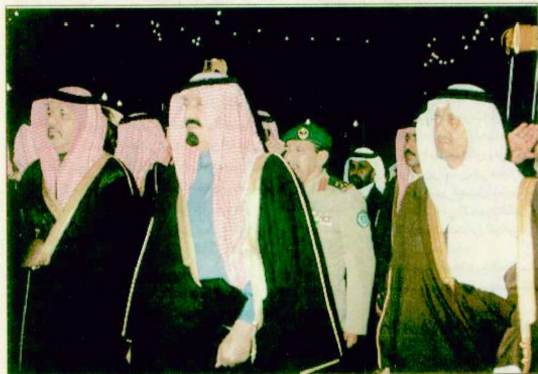
سمو ولي العهد لدى رعايته حفل وضع حجر الأساس لجريدة «الوطن»