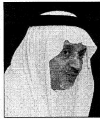
محافظة خميس مشيط