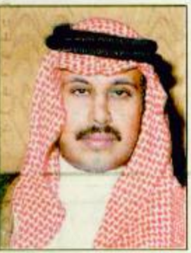
صاحب السمو الملكي الأمير مشاري بن سعود بن عبدالعزيز

واحاح المنطقة الشرقية بمدنها وقراها التابضة بالحياة والحب والفرح تؤكد الحقيقة الساطعة لموقع سمو ولي العهد الأمين الأمير عبدالله بن عبدالعزيز في وجدان الجماهير التي سعدت بهذه الزيارة الميمونة للمباركة للمنطقة الشرقية في وطن يصنع التحولات الحضارية... لقد عبرت الشرقية بكل فنائها عن عميق حبتها.. وصادق مشاعرها لهذه الزيارة الكريمة وقيام سموه بافتتاح بعض المشاريع الوطنية التنموية ومنها وضع حجر الأساس لمدينة الأمير عبدالله بن عبدالعزيز العسكرية بالأحساء. هذه الانجازات الحضارية تصب في خانة الصلحة العليا لهذا الوطن المعطاء وتأتي امتداداً للمنتجزات والمشاريع الممتدة في كافة مناطق ومدن المملكة.