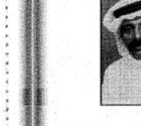
بمحافل عسير بالترحيب بصاحب السمو الملكي الأمير

يتشرف رئيس وأعضاء نادي الشهيد الرياضي بمحافل عسير بالترحيب بصاحب السمو الملكي الأمير عبدالله بن عبدالعزيز ولي العهد ونائب رئيس مجلس الوزراء ورئيس الحرس الوطني في زيارته الميمونة لمنطقة عسير متمنين لسموه الكريم طيب الإقامة بين أبنائه