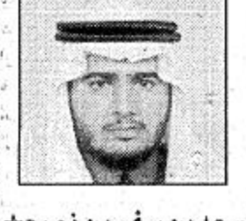
سعد بن سفر بن زميع

الزيارة والفرحة الغامرة إن زيارة سيدي صاحب السمو الملكي الأمير عبدالله بن عبدالعزيز ولي العهد ونائب رئيس مجلس الوزراء ورئيس الحرس الوطني يتطلع لها كل أبناء المنطقة وينتظرونها بفرحة غامرة حيث يحل سموه ضيفاً كريماً على منطقة عسير وأبنائها، فالفرحة تملأ القلوب وتعم القرى والهجر، فمرحباً بالقائد الحكيم والساعد الأمين لخادم الحرمين الشريفين بين أهله وأخوانه وأحبائه. فالقلوب ترحب وتسعد بقدومه والكل متفائل بهذه الزيارة الكريمة التي ستكون خير عطاء ونماء لهذا الجزء الغالي من وطننا الحبيب. رئيس مركز الواديين بالنيابة