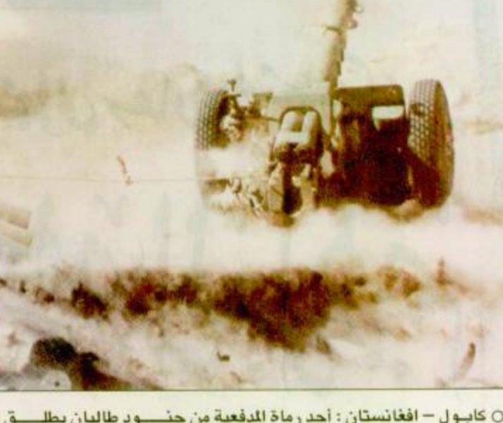
العاصمة كابول «أ. ف. ب.»