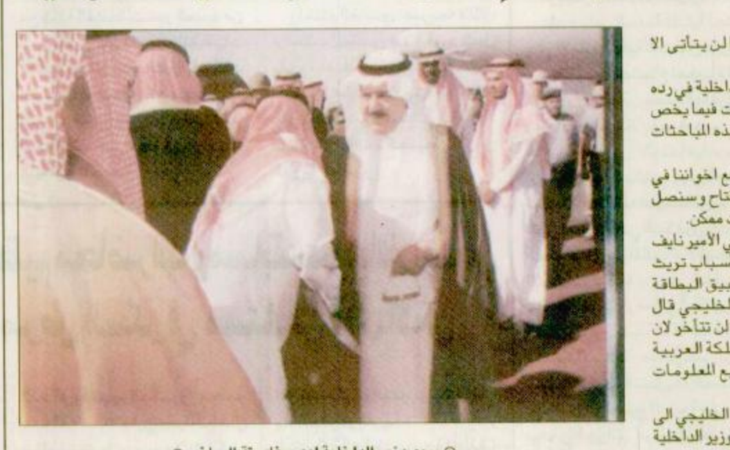
سمو وزير الداخلية لدى مغادرة الرياض