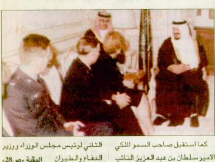
كما استقبل صاحب السمو الملكي الأمير سلطان بن عبد العزيز النائب

الرياض - واس : استقبل صاحب السمو الملكي الأمير سلطان بن عبد العزيز النائب الثاني لرئيس مجلس الوزراء وزير الدفاع والطيران والمفتش العام أمس في مكتب سموه بالرياض معالي نائب رئيسي الوزراء وزير الخارجية في الجمهورية اليمنية الدكتور عبد الكريم الأرياني وحضر المقابلة معالي وزير الدولة وعضو مجلس الوزراء الدكتور مساعد العبيان وسفير الجمهورية اليمنية لدى المملكة الدكتور محمد أحمد الكياب وتم خلال المقابلة بحث الأمور ذات الاهتمام المشترك.