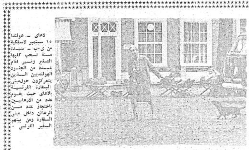
لاهاي - هولندا ١٥ سبتمبر لاسلكية من ريب - سيدنة مسنة تسحب كلها الصغر ونسب امام عسدد من الجنود الهولنديين السدين بنركون هولندي السفارة الفرنسية بلاهاي حيث يقوم عدد من الراهبين باحتجاج عدد من الرهان داخل مبنى السفارة ومن بينهم السفير الفرنسي

لندن في ١٥-٩-١٥ واف - اكدت صحيفة - الصنداي تلغراف - اليوم ان بريطانيا قد باعته الى اسرائيل ما يقرب من ٤٠٠ رباية من طراز - سنتريون - وهي في طريقها الان الى تل ابيب وترى الصحيفة ان هذه الصفقة قد تتبعها صفقة ديابات اخرى . وقد رفضت وزارة الخارجية ان تدلي بآي تعليق في هذا الشأن . وتأت اصحديت ان قيمة الصفقة قد سبق ان استخدمتها القوات البريطانية وان هذه الصفقة تهدف الى تعويض الخسائر الفادحة في القوات الدرعة الاسرائيلية اثناء حرب اكتوبر - وازدادت - الصنداي تلغراف - قائلة انه قد تم تطوير وتسليح هذه الديابات - ربما بصواريخ - في المصانع الاسرائيلية ذلك حتى يمكنها ان تواجه الديابات السوفيتية . وقالت الصحيفة ان قيمة الصفقة تزيد على ثمانين مليون جنيهه واوضحت الصحيفة ان هذه الاتباء قد اكدتها مصادر دبلوماسية في الشرق الاوسط . وتقول نفس هذه