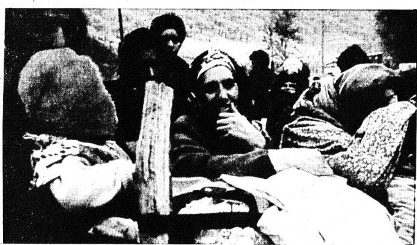
سيدات واطفال لادوا بالغار من قرية كالجبار شمالي لاتشين في اذربيجان في وقت سابق هذا الاسبوع هربا من الهجمات الوحشية للجيش الارمني وقد بلغ عدد الذين شردوا نتيجة هذا الهجوم 50,000 شخص حسب تقديرات الصليب الاحمر الدولي

واوضحت هذه المصادر ان الولايات المتحدة وبريطانيا وفرنسا تستعد لاصدار بيان مشترك يطلب من ليبيا مرة اخرى تسليم اثنين من المواطنين الليبيين يشبه في اشراكهما في تفجير طائرة بوينغ 747 لشركة بان ام فوق لوكربي / اسكتلندا / في ديسمبر 1988 مما اسفر عن مصرع 270 شخصاً.