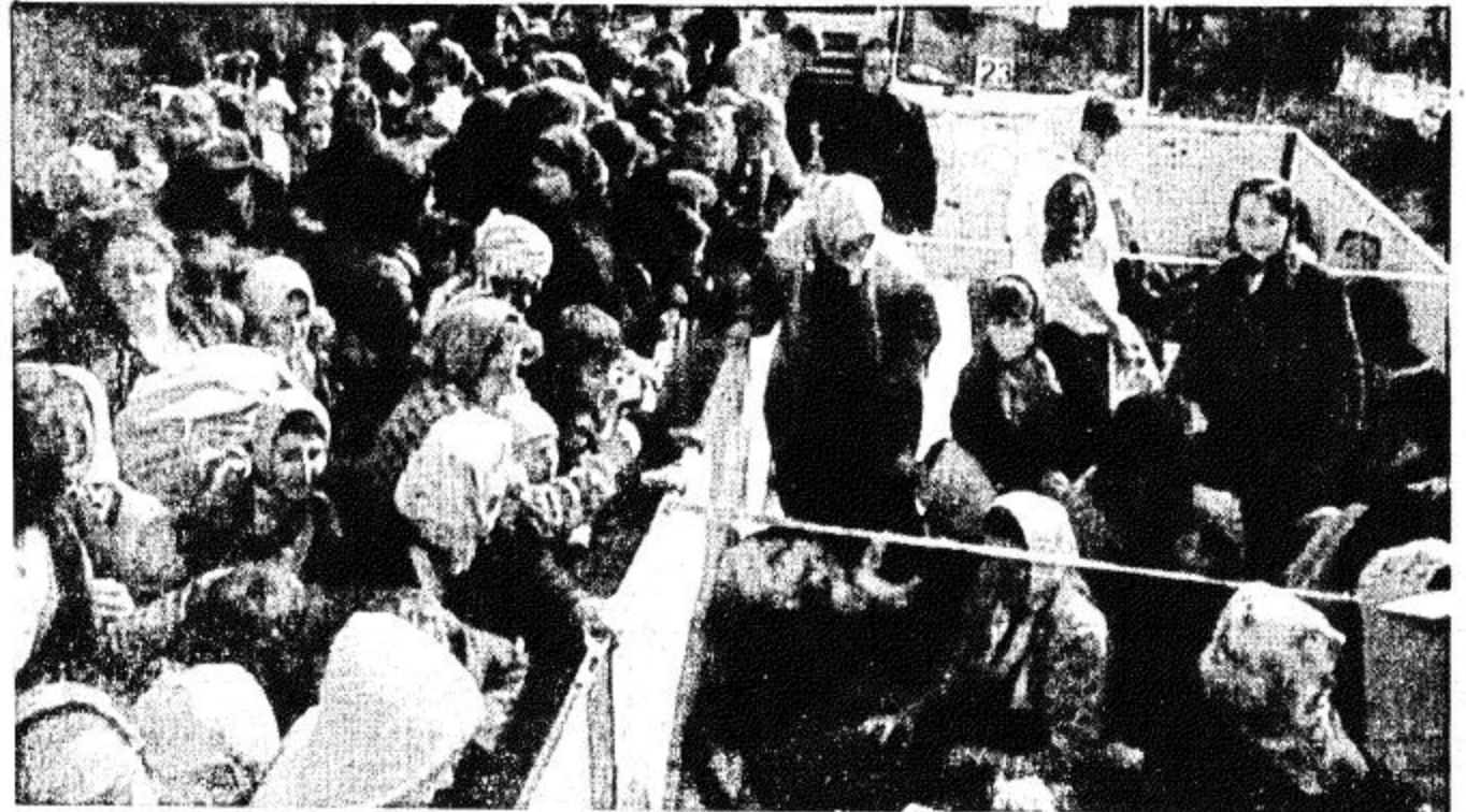
شاحنات محتشدة بالاجنات والسلمتات خلال عملية اجلاء اكثر من 2000 شخص من بلدة سيربرنتشا المسجلة في 14 شاحنة تابعة للامم المتحدة الى تولايوم الخميس