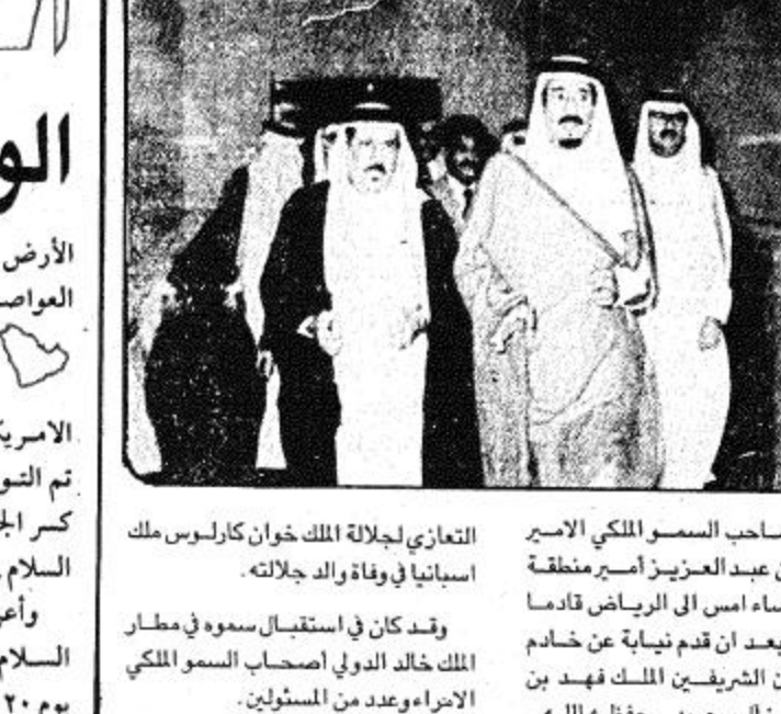
عاد صاحب السمو الملكي الامير سلمان بن عبدالعزيز امير منطقة الرياض مساء أمس الى الرياض قادما من مدريد بعد ان قدم نيابة عن خادم الحرمين الشريفين الملك فهد بن عبد العزيز ال سعود - حفظه الله -

قدم نيابة عن خادم الحرمين الشريفين التعازي لملك اسبانيا