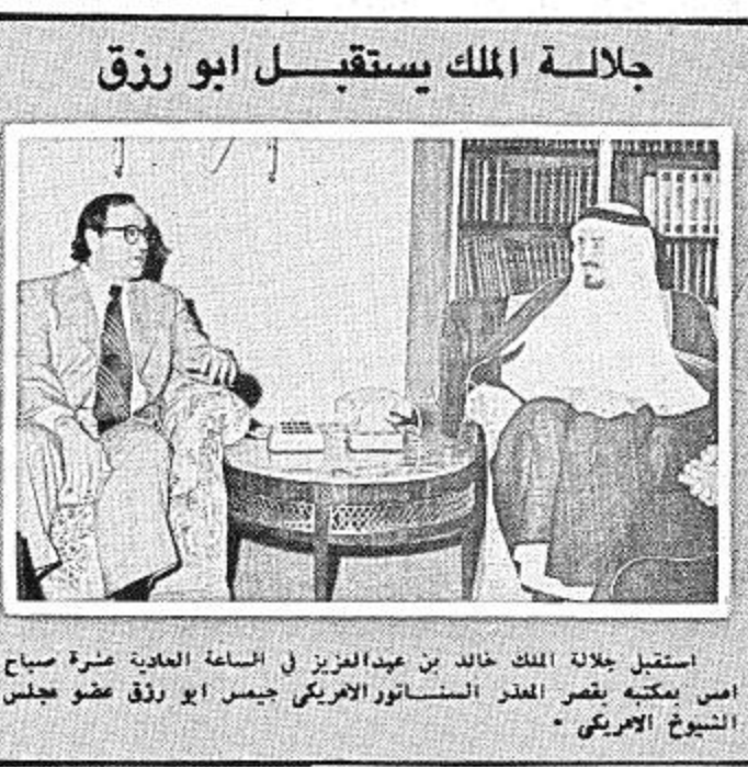
جلالة الملك يستقبل ابو رزق استقبل جلالة الملك خالد بن عبدالعزيز في الساعة العادية عشرة صباح امس بكتبة قصر الملك السناتور الامريكى جيمس ابو رزق عضو مجلس السناتور الامريكى