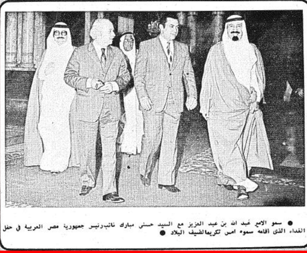
• سمو الامام محمد بن عبد الوهاب مع السيد حسني مبارك نائب رئيس جمهورية مصر العربية في حفل الفداء الذي اقامه سموه امس تكريماً لضيف البلاد

لقاء القصة بين الامام محمد بن سعود والشيخ محمد بن عبد الوهاب