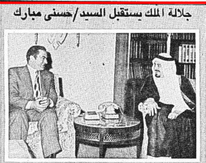
جلالة الملك يستقبل السيد/حسنى مبارك استقبل جلالة الملك خالد بن عبد العزيز المنظم بكتبه بليون الملكى بالمدر في الساعة العادية عشرة من صباح امس السيد حسنى مبارك نائب رئيس جمهورية مصر العربية . وقد حضر المراسلة صاحب السمو الملكى الامير عبد الله بن عبد العزيز الثالث لثاني لرئيس مجلس الوزراء ورئيس العرس الوطنى كما حضرها السيد اسماعيل فهمى نائب رئيس الوزراء ووزير الخارجية المصري

الرياض - واس - استقبل جلالة الملك خالد بن عبد العزيز المنظم بكتبه بليون الملكى بالمدر في الساعة العادية عشرة من صباح امس السيد حسنى مبارك نائب رئيس جمهورية مصر العربية . وقد حضر المراسلة صاحب السمو الملكى الامير عبد الله بن عبد العزيز الثالث لثاني لرئيس مجلس الوزراء ورئيس العرس الوطنى كما حضرها السيد اسماعيل فهمى نائب رئيس الوزراء ووزير الخارجية المصري . وكان السيد حسنى مبارك سيات رئيس جمهورية مصر العربية في وفد مكون من خمسة افراد من بينهم وزير الخارجية المصري السيد اسماعيل فهمى نائب رئيس الوزراء ورئيس مجلس الوزراء ووزير الخارجية المصري . وكان في استقباله امير منطقة الرياض . كما كان في استقباله عدد اخر من المسؤولين . هذا وقد اقام صاحب السمو الملكى الامير عبد الله بن عبد العزيز الثالث لثاني لرئيس مجلس الوزراء ورئيس العرس الوطنى حفل غداء في قصر الضيافة بعد ظهر امس تكريماً للسيد محمد حسنى مبارك نائب رئيس جمهورية مصر العربية حضرها السيد اسماعيل فهمى نائب رئيس الوزراء المصري وعدد من اصحاب السمو الامراء والمساعدين لوزراء . ومن جهة اخرى اقام السيد حسنى مبارك بالرياض في الساعة الثانية من بعد ظهر امس متوجهاً الى مسقط . وكان في وداعه في المطار صاحب السمو الملكى الامير عبد الله بن عبد العزيز الثالث لثاني لرئيس مجلس الوزراء ورئيس العرس الوطنى وصاحب السمو الملكى الامير سلطان بن عبد العزيز وكيل امير منطقة الرياض ومعالي الدكتور محمد بن عبد الوهاب وزير الاعلام ومعالي السيد احمد عبد الوهاب رئيس المراسم الملكية وعدد من المسؤولين .