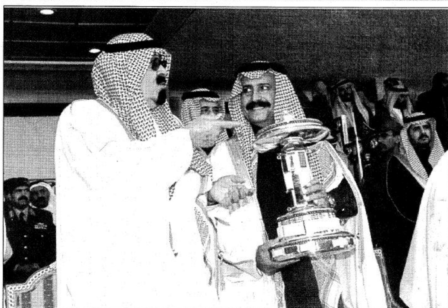
سمو ولي العهد يبارك فوز الأمير سلطان بن محمد