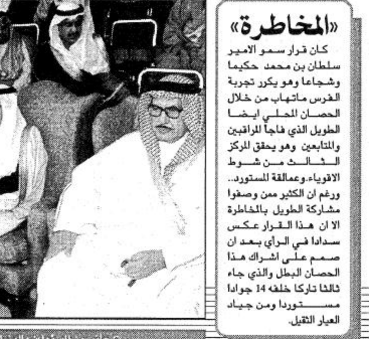
○ جمران يحافظ على لقبه رغم وجود حارس الويلاد ○ شالي، طابن ما طابن والسبحان ونفسي ثابرة أحداث سباقات الأسير ○ جاب من المسؤولين والوزراء الذين حضروا سباق الأسير

«المخاطرة» ○ كان قرار سمو الأمير سلطان بن محمد حكيمياً وشجاعاً وهو يكرر تجربة الفرس ماتهاب من خلال الحصان المحلي أيضاً الطويل الذي فاجأ المراقبين والمناصبين وهو يحقق المركز الثالث من شوط الأضواء وعمالة للمستود.. ورغم أن الكثير من وصفوا مشاركة الطويل بالمخاطرة إلا أن هذا القرار عكس سداداً في الراي بعد أن صمم على اشراك هذا الحصان البطل والذي جاء ثالثاً تاركاً خلفه 14 جواداً مستوداً ومن جواد العيار الثقيل.