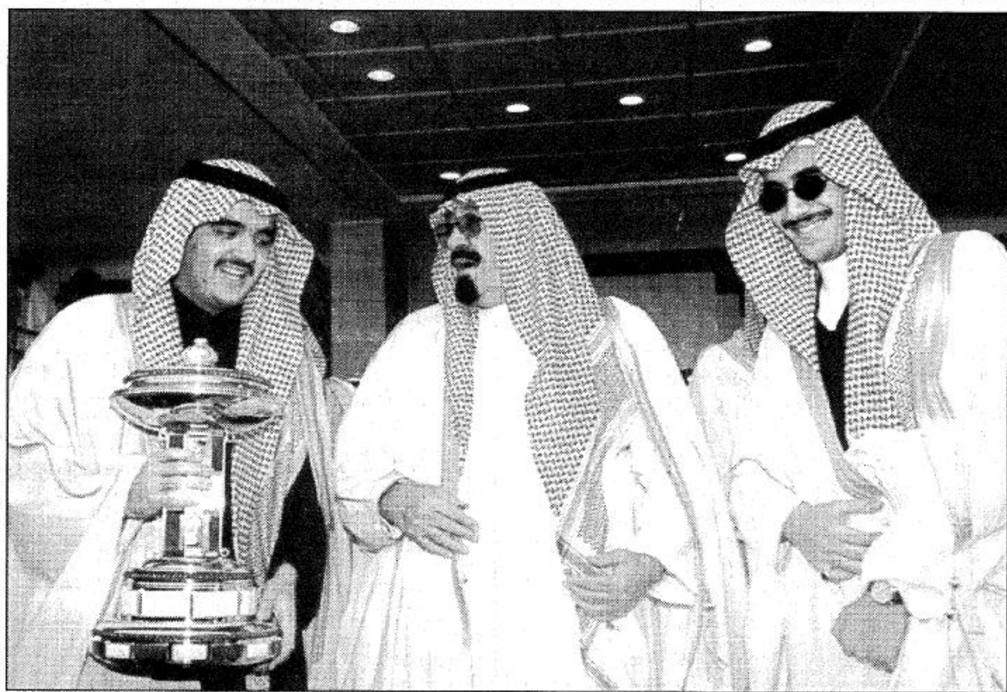
تهنئة من أمير الفروسية للأميرين عبد العزيز وتوفيق بن فيصل عقب التتويج

وهج جمران أشعل الميدان.. من عانده في الفوز.. خسران