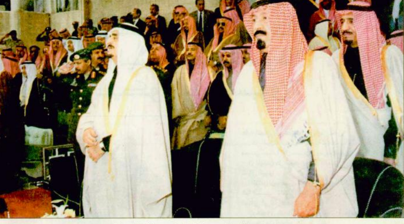
○ خادم الحرمين الشريفين وسمو ولي العهد في إحدى سباقات الفروسية

اما الحصان عون الله فإنه قد حظي بنسب ترشيحية عقب ادائه في مشاركة الطويل «انتاج» وسيدون من سباقه مع فايز يساعده في ذلك تركيبه الجسماني وهو جواد وان كان يعسود بعد اصابة لكن وضع انها تلاشت تماما الامر الذي يعطيه قدرة على التواجد مع طبعة الجواد فسي دورتها الثانية وعند مرحلة الحسم. الفرس الاعلامية وانما اسلم اعلامي لا حدود له وربما كان ردها قويا على من وصف مشاركتها في الشوط بالمجازفة غير مضمونة النتائج. اما الحصان ميهج فهو يشارك لأول مرة ويقوده خيال محترف ولا يمكن اغفاله.