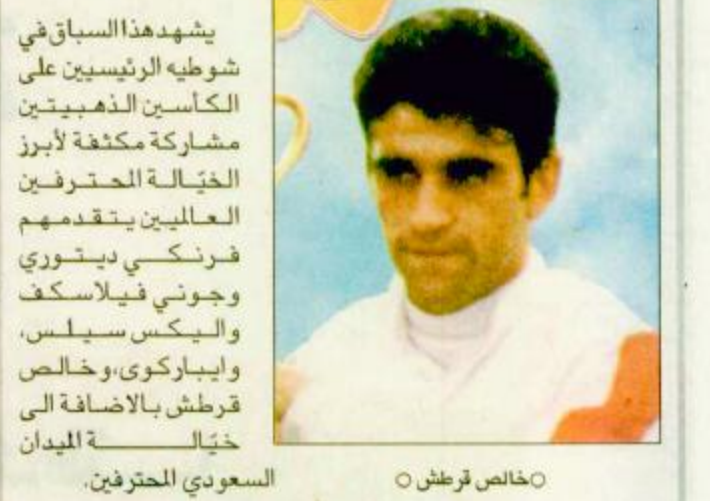
○ خالص فرطش ○ السعودي المحترفين.