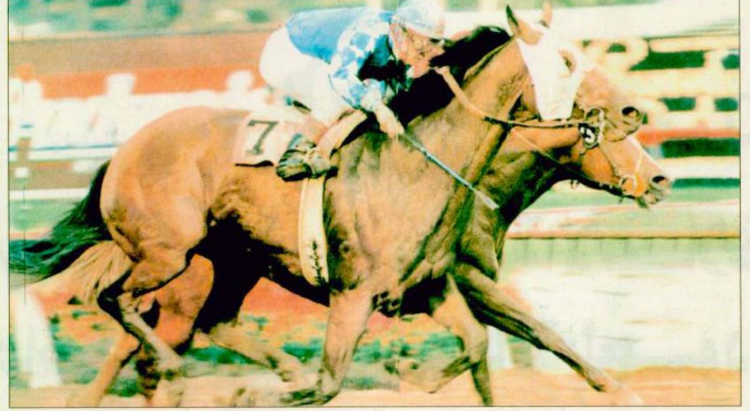
○ جمران حامل لقب كأس سمو ولي العهد للمستورد في إحدى مشاركاته الخارجية ○

ثلاثة اسابيع ولم تكف بذلك الفوز الصارخ بل حملت رقم مسافة ذلك الشوط برقم عالي بلغ 1.59 دقيقة وهو نفس مسافة سباق اليوم الامر الذي يؤهلها للكسب بنسبة كبيرة لغزيتها الفاتحة على الترشح بالقرب من مقدمة الجياد ثم الانطلاق نحو الحسم بمستوى قوي جدا. الفرس عدا ستكون مكلفة بمهمة التصدي لانطلاقه عز الطلب والبشر الا انها ستواجه صعوبة في ذلك انا ما عرفنا ان الفرس نزوح تجهد الانطلاق السريع ومكلفة بمهمة مسافة مكنته. شدة تسعى لمواصلة تعلقها غير انها ستفقد لراكية خيالها خوزيه والذي سيقدوم ما تهاب في هذا الشوط ضرار ربما كان له ظهور في هذا السباق وان قلت نسبته الترشحية عن ماتهاب وشودة والبشر والذي يعود بعد غيبة طويلة يشارك على أمل احتلال احد المراكز الشرفية في اخر سباقاته وان كانت مهمة ستكون صعبة الا انها غير مستحقة. الفرس 2000م تستحوز الفرس ماتهاب على النسبة الترشحية الاكبر بعد مشاركتها الشجاعة والناجحة وهي تتوق على افراس المستورد قبل