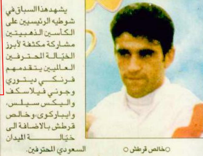
○ خالص قرطش ○ السعودي المحترفين.