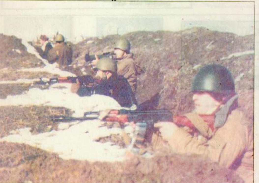
جنود شيشانيون متاهبون في خندق لحماية جروزي