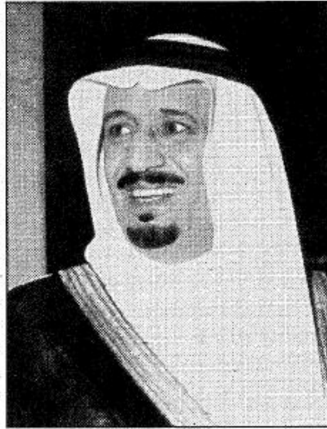
○ الأمير سلمان بن عبدالعزيز