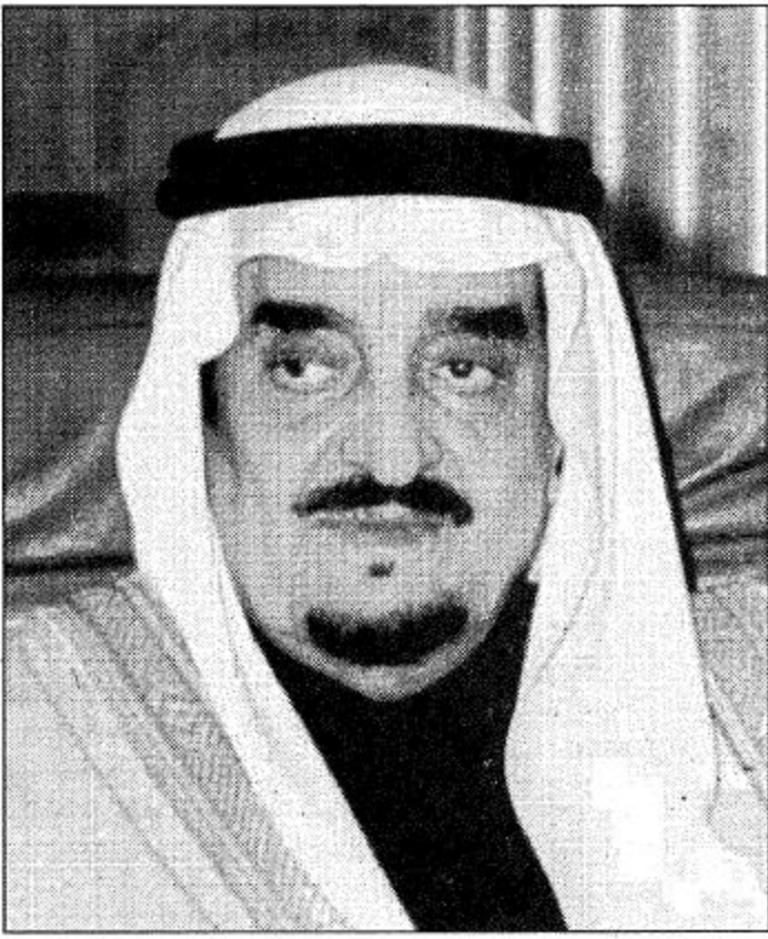
○ خادم الحرمين الشريفين

يقوم صاحب السمو الملكي الأمير عبدالله بن عبدالعزيز ولي العهد ونائب رئيس مجلس الوزراء ورئيس الحرس الوطني مساء اليوم بزيارة تفقدية لمرافق مركز الملك عبدالعزيز التاريخي والذي رعى افتتاحه خادم الحرمين الشريفين الملك فهد بن عبدالعزيز في الخامس من شهر شوال الماضي وتولت الاشراف على انشائه الهيئة العليا لتطوير مدينة الرياض برئاسة صاحب السمو الملكي الأمير سلمان بن عبدالعزيز أمير منطقة الرياض والذي وضع حجر الأساس للمركز وتابع انشاءه حتى أنجز في فترة قياسية. وفيما يلي جولة استطلاعية عن المركز: