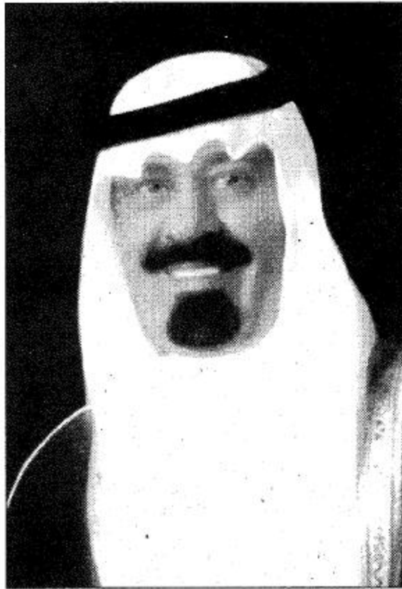
○ سمو ولي العهد