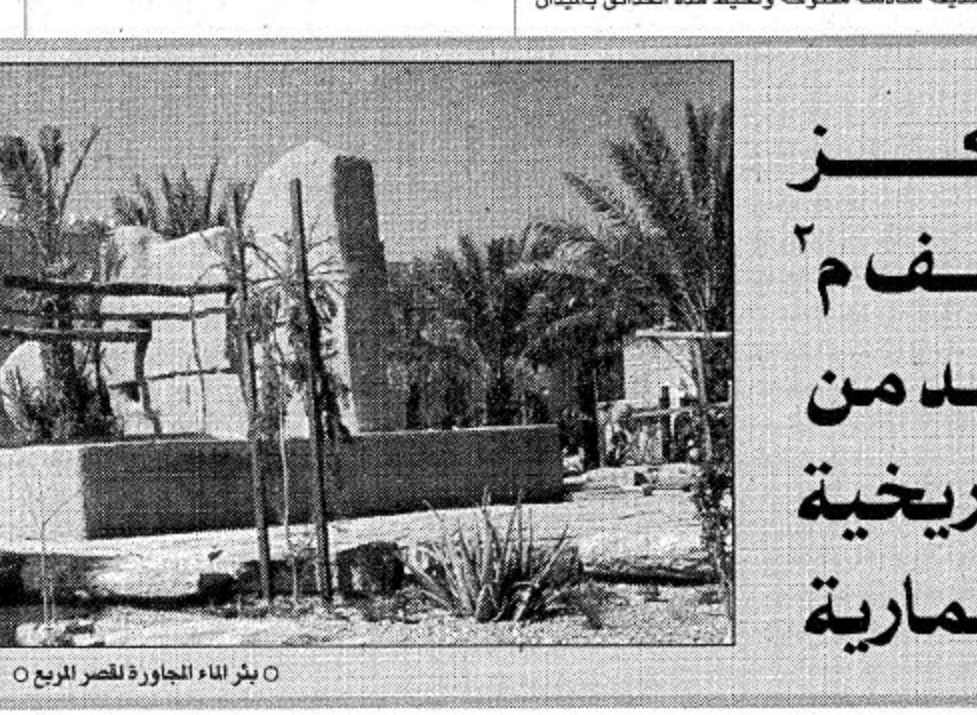
○ بئر الماء الجاورة للقصر الربيع

التي يمكن المحافظة على بعضها وهي تلك المباني الواقعة في الغرب من قصر الربيع نظراً لحالتها الانشائية القوية ولأنها تشكل في مجموعها نموذجاً للتصميم العمراني التقليدي في منطقة الرياض ليمكن استخدامها لأغراض مناسبة. كذلك المحافظة على البورج وبها السوق القائمة في شمال الموقع كإحدى بقايا حدود منطقة قصر الربيع القديمة نظراً لحالتها الانشائية الجيدة كما روي المحافظة على واحد من البيوت الطينية المتهدمة الواقعة في الجهة الشمالية من المنطقة قرب البرج الطيني حيث تمت إزالة معظم جدرانه المتهدمة والإبقاء على جدران هذا المبنى للهدم بإرتفاع يتراوح بين 20 و100 سم فوق الأرض ليمكن لزوار المنتزه العبور من خلاله والتعرف على كيفية شكل البناء القديم وتصميم الفراغات الداخلية فيه.