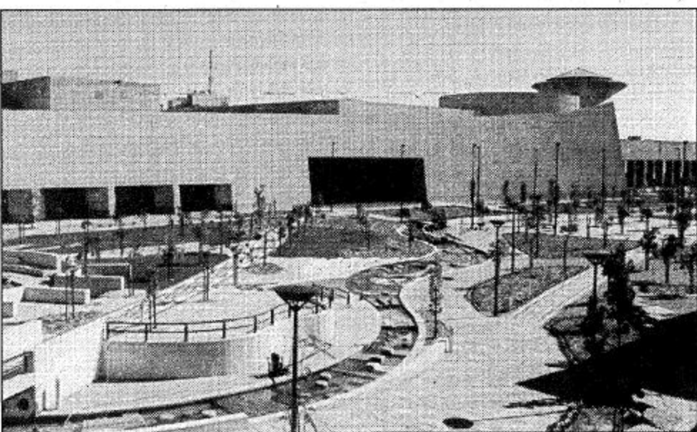
○ تنسيق الحدائق بهذا الشكل في المركز

شيكات المرافق العامة أنشئت ضمن المشروع شبكات المرافق الرئيسية وتشمل