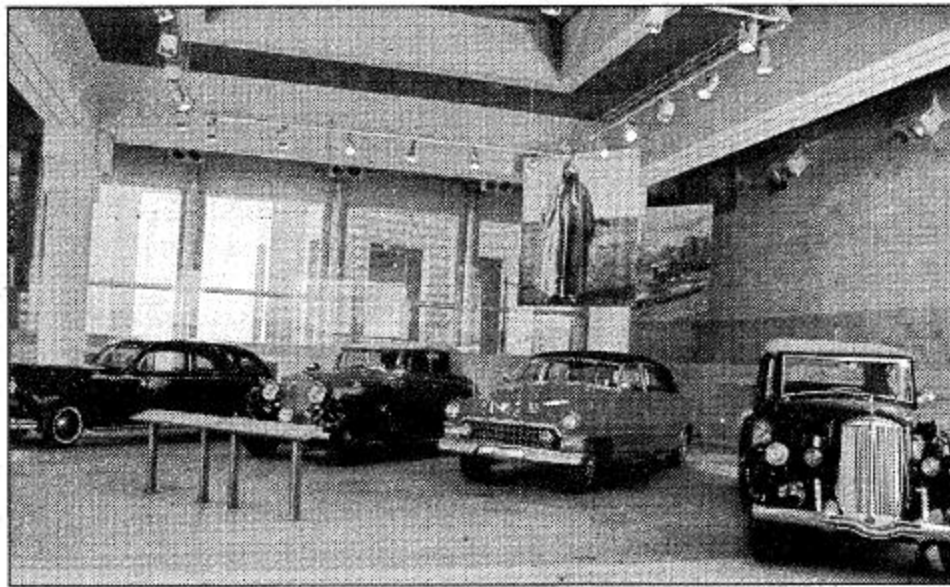
○ سيارات الملك عبدالعزيز العروضة