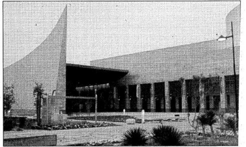
○ مدخل المتحف روعة في التصميم

الكهرباء والهاتف ومياه الشرب والصرف الصحي وصرف مياه السيول ومياه الري وتم تغطية المنتزه العام في المركز بمياه ري من شبكة المياه الريسية الواقعة تحت طريق الملك فهد بعد تثقيفها.