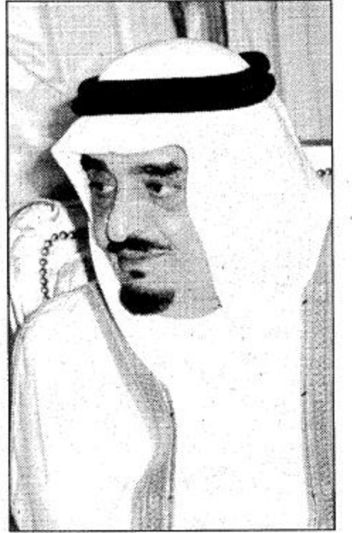
○ خادم الحرمين الشريفين