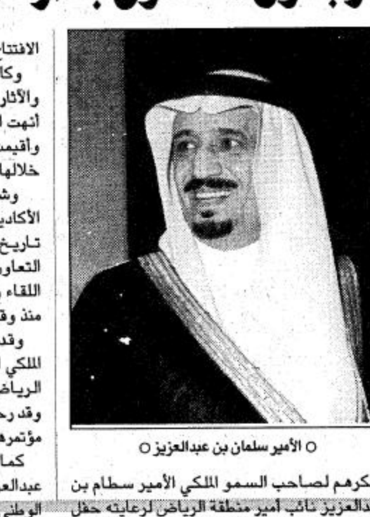
○ الأمير سلطان بن عبدالعزيز

الانتاج وتوجيه كلمة ضافية بهذه المناسبة. وكانت أعمال اللقاء العلمي الثاني لجمعية التاريخ والآثار بدول مجلس التعاون لدول الخليج العربية قد أنهت اجتماعها مساء يوم الخميس 22/1/1421هـ وأقيمت فعاليات اللقاء على مدى ثلاثة أيام قدمت خلالها سبع جلسات. وشارك في حضور هذه الندوات العديد من الأكاديميين والباحثين والباحثات في مجال دراسة تاريخ وآثار الجزيرة العربية من دول مجلس التعاون الخليجي وتظمت دائرة الملك عبدالعزيز هذا اللقاء وأعدت له برنامجا متكاملًا وتم التحضير له منذ وقت مبكر. وقد شمل برنامج اللقاء زيارة صاحب السمو الملكي الأمير سلطان بن عبدالعزيز نائب أمير منطقة الرياض في مقر الامارة وقصر الحكم والمصمك، وقد رحب سموه بالضيوف وضمني لهم التوفيق في مؤتمهم. كما تم زيارة داره الملك عبدالعزيز وقاعة الملك عبدالعزيز التذكارية، وقصر الريع، وكذلك التحف الوطني وآثار الدرعية القديمة.