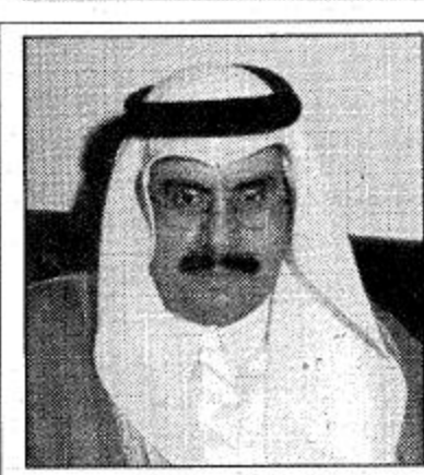
○ سفير عُمان له الجزيرة

وإذ فإن القمة التشاورية قمة الحوار والتواصل سوف تعطي دفعة جديدة لمسيرة المجلس المباركة لمواجهة التحديات المقبلة في ضوء التطورات الجارية على الساحة الدولية وظهور التكتلات المختلفة الاقتصادية والسياسية وغيرها. وكون مجلس التعاون الخليجي قد قطع منذ قيامه في الخامس والعشرين من شهر مايو لعام 1981م شوطا كبيرا وخطوات هامة وإيجابية على طريق مسيرة العمل المشترك لتحقيق آمال وطموحات أبناء دول المنطقة خاصة بعد ان أصبح كيانا وحيقة واقعة للعيان. فإنه من حق أبناء وشعوب المنطقة ان ترى وتلمس انجازات أكثر ونتائج أفضل في المرحلة المقبلة تصل الى مستوى الطموح والتطلع والامل المنشودة.