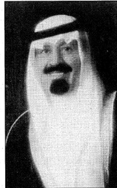
○ سمو ولي العهد