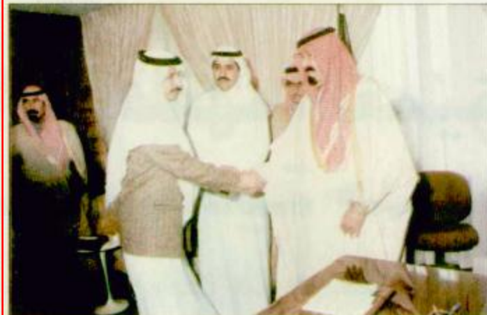
الرياض/بعثة الجنادرية: استقبال صاحب السمو الملكي الأمير عبد الله بن عبد العزيز ولي العهد ونائب رئيس مجلس الوزراء ورئيس الحرس الوطني في مكتب سموه برئاسة الحرس الوطني أمس للمشاركة في نشاطات أمسيات الأدب الشعبي البقية «ص ٢٧»

لندن - واس. وصل الى لندن أمس الأربعاء صاحب السمو الملكي الأمير سلطان بن عبد العزيز النائب الثاني لرئيس مجلس الوزراء وزير الدفاع والطيران والمفتش العام في زيارة رسمية للمملكة المتحدة. وكان في استقبال سموه بمطار هيثرو الدولي معالي وزير الدولة البريطاني لشؤون الدفاع نيكولاس سوزم ممثلاً لرئيس الوزراء البريطاني وسفير المملكة العربية السعودية لدى المملكة المتحدة إيرلندا الدكتور غازي القصيبي والمخض المشرك السعودي في لندن العميد طيار البقية «ص ٢٧» تفاصيل زيارة سمو الأمير سلطان «ص ٢»