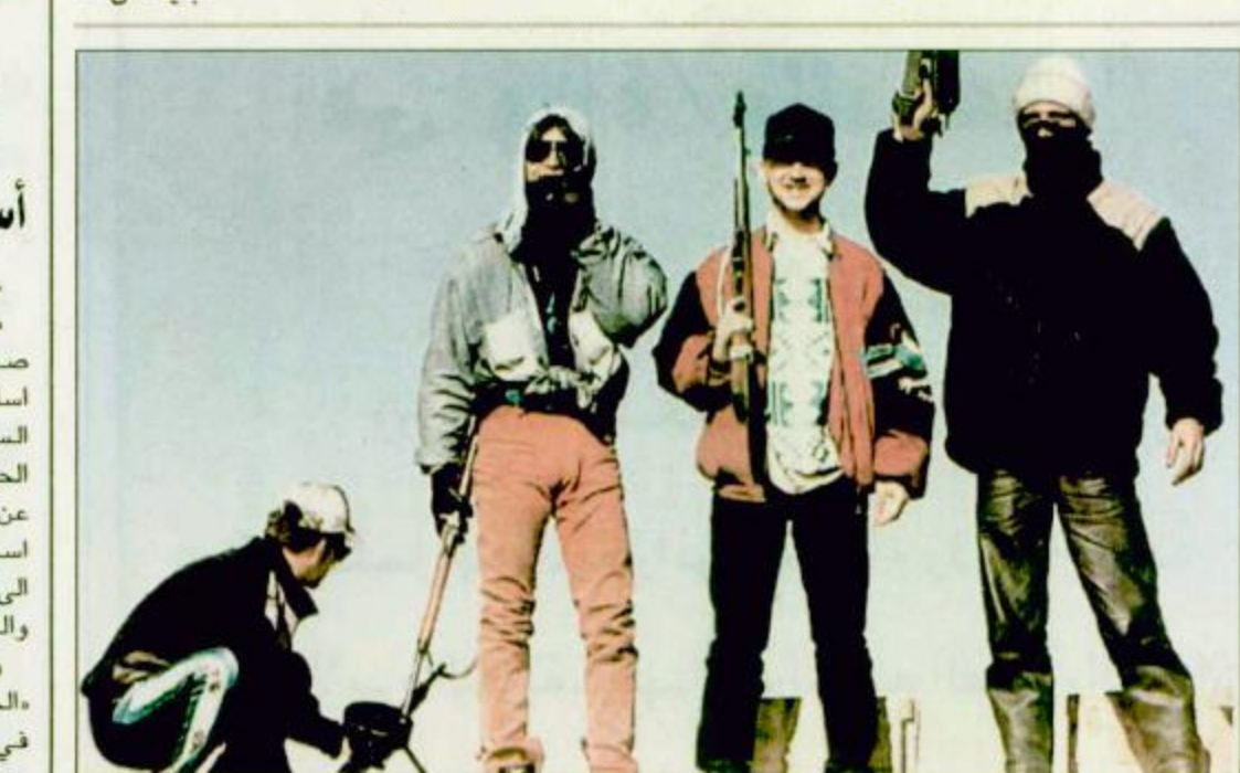
بوشينج - ابانيا: متمردون لبان مسلحون يقفون على سطح حافلة دمرتها النيران عند أحد المزارع بالقرب من بوشينج ١٠. ف.ب.

عمان - ق.ن. نفى الرئيس اليمني علي عبد الله صالح ان تكون بلاده قد أرسلت أسلحة عراقية كانت مخزنة لديها في السودان لمساعدة الدولة هناك في الحرب الدائرة مع المتطرفين وتسأل عن كيفية استطاعة العراق إرسال أسلحة وصواريخ ومعدات عسكرية الى اليمن لتخزينها وللأحزاب البحرية والجوية مرصودة ومراقبة. واتهم في حديث مع صحيفة «الحياة» الأردنية الأسبوعية نشرته في عددها الصادر اليوم الخميس بعض القوى العابدة بالوقوف وراء الهجمة التي يتعرض لها اليمن.