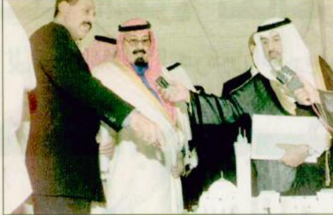
□ لفظتان من حفل وضع حجر الأساس لجامع خادم الحرمين الشريفين في جنوب أفريقيا

هذا البلد الصديق، إن الإسلام دين سلام ومحبة وإخلاص ووفاء للعقيدة الإسلامية ولكل مسلم والأسلا هو للبناء لا للهدم. أخواني أوصيكم بتقوى الله أولاً واخيراً والتكاتف فيما بينكم وخدمة بلدكم ونفي وإبعاد كل دخيل عليكم يدعي الإسلام وهو يعمل لتكبير سفوككم كمسلمين واخوة هذه امانة في ايمانكم واعناق ابنائكم أن ترغبوا من شأن الإسلام إلى الإسلام الصحيح الذي هو خاتم الرسالات فلا غير الله يعبد.