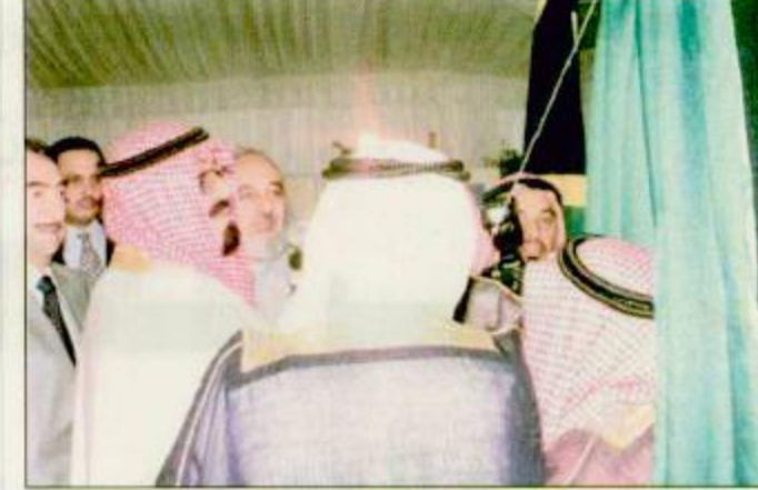
□ لفظتان من حفل وضع حجر الأساس لجامع خادم الحرمين الشريفين في جنوب أفريقيا

والس، الملك الامير عبدالله بن عبدالعزيز الكلمة التالية، بسم الله الرحمن الرحيم اخواني ولشقيقي احبيكم تحية الاسلام السلام عليكم ورحمته وبركاته نضع في هذا اليوم المبارك يوم الجمعة حجر الأساس لجامع اخر خادم الحرمين الشريفين اسأل الله ان يوفقه دائماً وايداً في الدنيا والاخرة كما اسأل الله ان يوفق اخواني المسلمين في جمهورية جنوب أفريقيا المسلمي على اداء واجبه مع اخواتهم المسلمين في