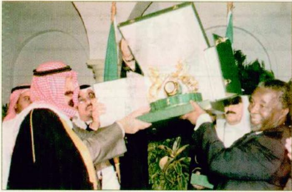
سمو ولي العهد يتبادل الهدايا مع نائب الرئيس الجنوب افريقي