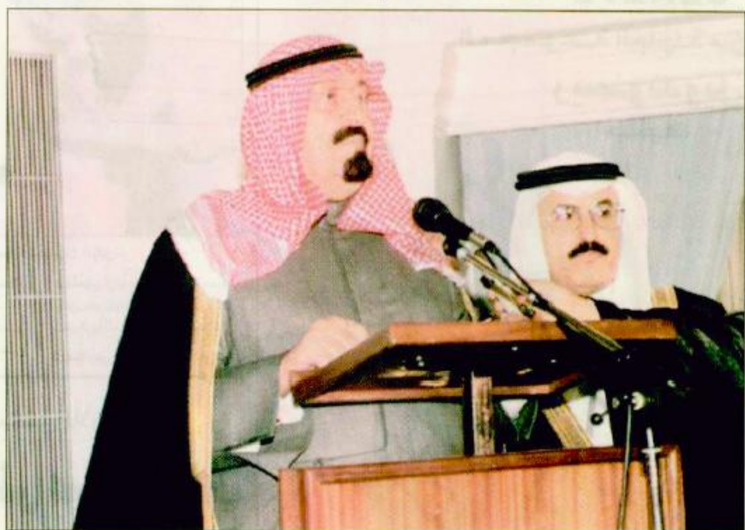
سمو ولي العهد يوجه كلمة لرجال الأعمال

شكره وتقديره لساحب السمو الملكي الأمير عبدالله بن عبدالعزيز على هذا الاستقبال وثابته هذه الفرصة الطيبة ليسمع الجميع