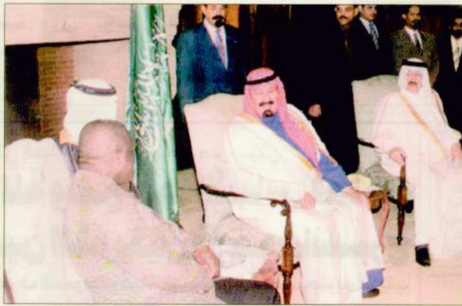
سمو ولي العهد يستقبل رجال الأعمال في جنوب أفريقيا