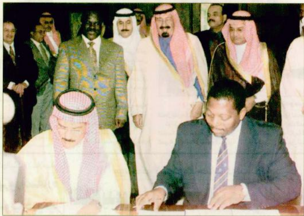
توقيع مذكرة تفاهم

شكره وتقديره لساحب السمو الملكي الأمير عبدالله بن عبدالعزيز على هذا الاستقبال وثابته هذه الفرصة الطيبة ليسمع الجميع