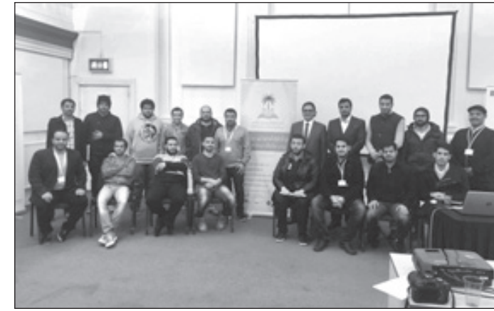
ملتقى المراعي مع الطلاب السعوديين المبتعثين بالمملكة المتحدة

ويتوفر التطبيق الجديد باللغتين العربية والإنكليزية ويسمح للمستخدمين بتخصيص تجربتهم عبر التسجيل باستخدام حساباتهم على فيسبوك أو «غوغل بلس». كما يوفر وظائف متخصصة تتيح للمتنسوقين تخصيص فئات التسوق وتفضيلاتهم الشخصية. وتشمل المزايا الرئيسية للتطبيق الجديد قائمة حديثة للعروض الترويجية، وموقع مركز التسوق، وخريطة تفاعلية، ودليل المتجر، ومعلومات عامة حول كل مركز تسوق بما في ذلك أوقات العمل، ووصف المركز ومعلومات الاتصال بخدمة العملاء.