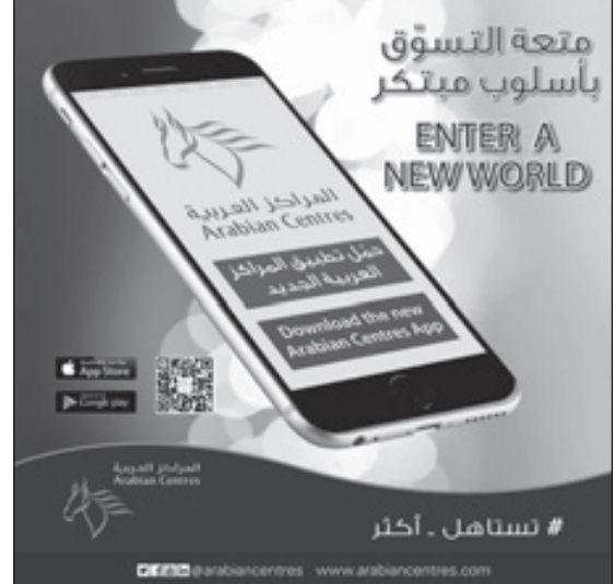
يوفر التطبيق المعلومات الأساسية حول مراكز التسوق

ويسمح التطبيق أيضاً لتجار التجزئة وللعملاء التجارية بتزويد العملاء بأحدث المستجدات حول العروض الترويجية، ليشكل أداة حاسمة بالنسبة للمستهلكين الراغبين بتحديد الصفقات الأفضل، ولتجار التجزئة لزيادة مبيعاتهم. وجاء إطلاق تطبيق التسوق الجديد بعد الكشف عن تطبيق الواقع المعزز الذي أطلقته المراكز العربية بالشرق الأوسط، وفي وقت سابق من العام الحالي، والذي يقدم مجسماً افتراضياً لـ«الحمراء مول» في الرياض، ويعد أول تطبيق للواقع الافتراضي من نوعه خاص بمركز تسوق في المملكة.