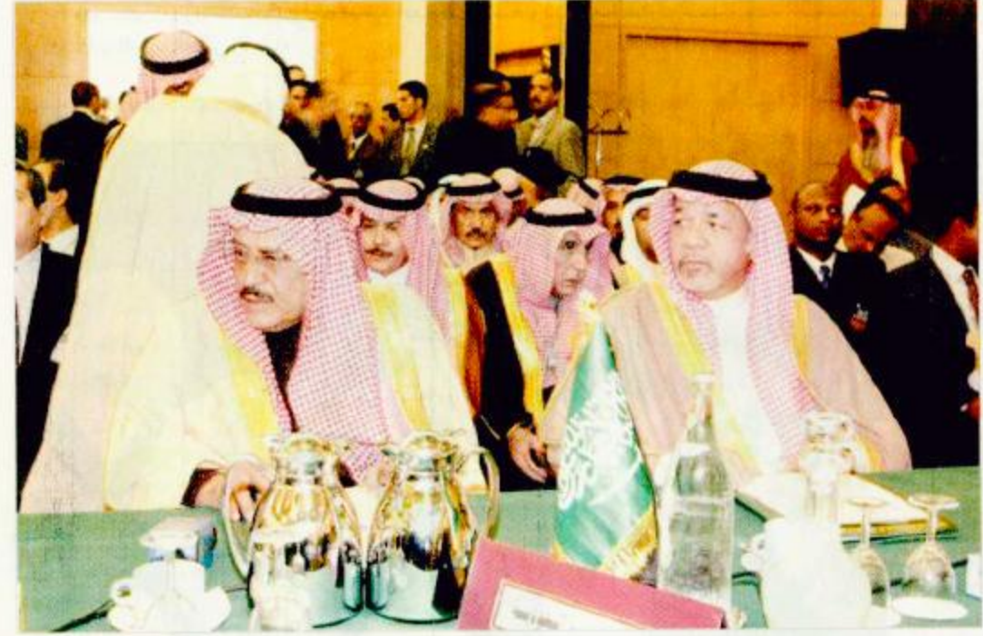
الأمير نايف ود. الفارسي خلال الاجتماع المشترك بين مجلسي وزراء الداخلية والإعلام العرب

التحرر والاستقلال ومكافحة الاحتلال والعدوان الاجنبي. كما جدد المجتمعون ادانتهم الشديدة للإرهاب بكل صوره واشكاله مع ضرورة التمييز بين الإرهاب وحق الشعوب في مقاومة الاحتلال والعدوان الاجنبي ورفضهم القاطع محاولة الصاق تهمة الإرهاب بالعرب والمسلمين وتأكيدهم على ما يدعو اليه الإسلام من مبادئ سحمة ونهذ لكافة أشكال العنف والتطرف. كما اشادوا بصمود الشعب الفلسطيني وانتفاضته الباسلة وتأكيد تضامنهم ودعوة المجتمع الدولي الى تأمين الحماية الدولية للشعب الفلسطيني من إرهاب الدولة الذي تقارسه إسرائيل ورفع الحصار الظالم عن الشعب الفلسطيني وسلطته الوطنية برئاسة فخامة الرئيس ياسر عرفات وتطبيق قرارات الامم المتحدة بوضع حد للعدوان وانسحاب إسرائيل من جميع الأراضي العربية المحتلة الى حدود الرابع من يونيو 1967م واقامة الدولة الفلسطينية المستقلة وعاصمتها القدس الشريف.