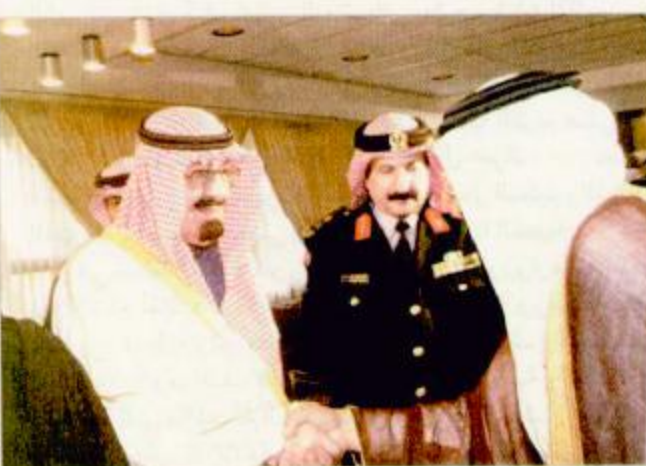
ولي العهد خلال استقبال المواطنين