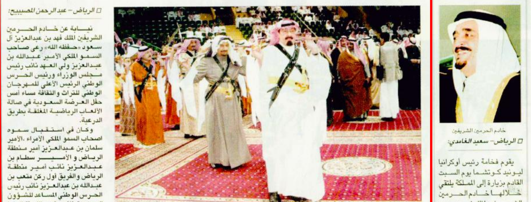
سمو ولي العهد يزدي العرضة السعودية مع عدد من الأمراء

تأجيل زيارة الرئيس بشار الأسد إلى إيران دون تحديد الجهة التي الغتها. وقال المتحدث باسم وزارة الخارجية السورية أمس الأربعاء إن ما تناقلته وسائل الإعلام بموعد الزيارة لم يكن دقيقاً. وفي وقت سابق من يوم أمس أعلن مسؤول في رئاسة الجمهورية الإيرانية طلب عدم الكشف عن اسمه عن أن الزيارة التي كان من المقرر أن يقوم بها الرئيس السوري إلى طهران أمس قد ألغيت، من دون أن يقدم أي شروحات إضافية أو توضيح حول ما إذا كانت الزيارة ستتم في موعد لاحق.