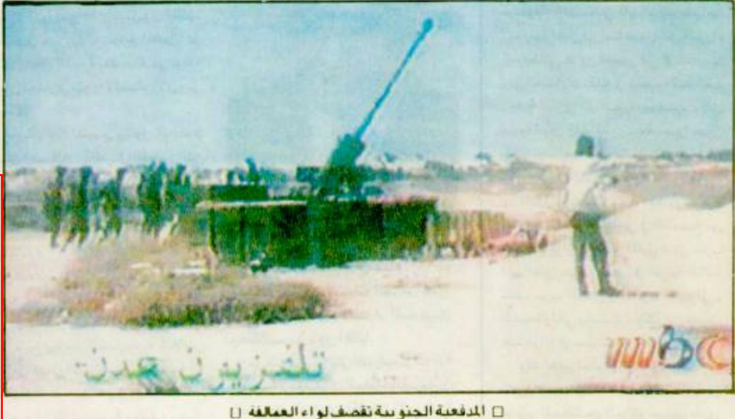
المدفعية الجنوبية تصف لواء العالقة

وقال معالي وزير المعارف في تصريح خاص لـ «الجزيرة» ان حضور الملك المفدى لهذا الاحتفال وتكريمه ابناءه الطلاب ليس غريبا او جديدا فهو راشد التعليم في المملكة وارسل من وضع لبيات التعليم في بلادنا. واشار معالي وزير المعارف الى ان الملك فهد بن عبد العزيز ومنذ ان كان في وزارة المعارف ثم في وزارة الداخلية ثم وليا للعهد ثم عهد الزاهر كملك للمملكة وهو يولي التعليم جل اهتمامه ورعايته. وتوجه الخويزر في هذا الصدد بهذه الرعاية السامية وقال ان التعليم في بلادنا يحظى بظهير رعاية الملك المفدى وهكذا وجدنا النظر والفكرات الاكاديمية تزهو يوما بعد الاخر فقد سبق وان وضع حفظ الله في ذمته خطة حكيمه تلمس انهارا وتسانجها هذه مجلس الشورى يعقد جلسته القادمة عقد مجلس الشورى يوم امس الاول الاحد جلسته الاعتيادية الثامنة في دورة انعقاده الاولى لعام ١٤١٤هـ برئاسة معالي رئيس المجلس الشيخ محمد بن ابراهيم بن جبير وبحضور معالي نائب الرئيس والامين العام وعضوا المجلس. وقد استمرت الجلسة طبقا لـ «واس» لمدة يومين متتاليين استعرض فيها المجلس التقارير المقدمة من اللجان المتخصصة اضافة الى ما احالته اليه الهيئة العامة للمجلس من موضوعات واتخذ بشأنها القرارات المناسبة. ويتقرر هذا الاجتماع اخرا اجتماع اعتيادي قبيل اجازة عيد الاضحي المبارك وسيستأنف المجلس اجتماعاته الاعتيادية يوم الاحد الموافق ١٤١٤/١٢/٢٦هـ. البقية ص ٣٠