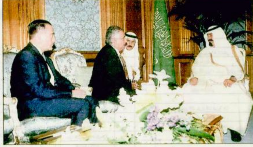
تسلم صاحب السمو الملكي الأمير عبد الله بن عبد العزيز ولي العهد نائب رئيس مجلس الوزراء ورئيس الحرس الوطني رسالة من فضامة رئيس جمهورية المكسيك أرنيستو زيبو تتضمن دعوة سموه لزيارة المكسيك. استقبال سموه له البقية ص ٣٢