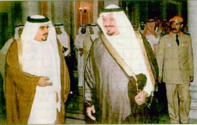
فهد بن عبد العزيز آل سعود عامل للمملكة هنا تصحفاً، حضرة الولد العزيز خادم الحرمين الشريفين الملك عبد العزيز آل سعود مع وفد من المسؤولين السعوديين في جدة، ١٧ ربيع الأول ١٤٢٠هـ

جدة - واس، كمالاً في رواج سموه نائب رئيس الراسم المكية منصور محمد الخريفي وأمين محافظة جدة الدكتور نزيه حسن نصيف ومدير عام مطار الملك عبدالعزيز الدولي المهندس سامي مقبول وقائد المنطقة الغربية اللواء الركن صالح الهديان وفلاح الاسطول الغربي اللواء بحري ركن صالح العجلان. وقد بحث سمو الشيخ سلمان بن حمد آل خليفة ولي العهد والقائد العام لقطر مع وفد البحرين برفقة آل خادم الحرمين الشريفين في ختام زيارته.