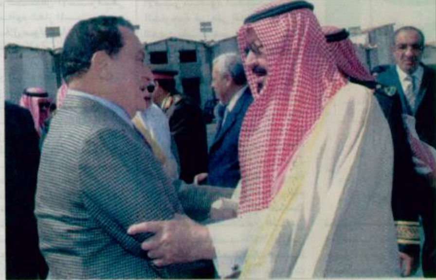
الرئيس حسني مبارك يودع سمو ولي العهد