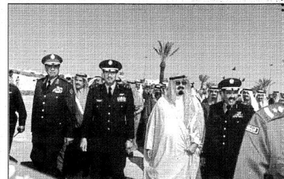
سموه لدى وصوله