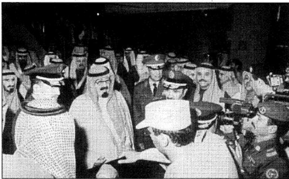
سموه يستمع لشرح عن المتحف