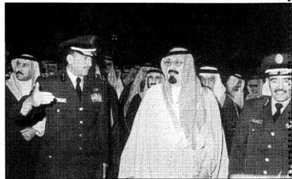
سمو ولي العهد في جولته في متحف صقر الجزيرة