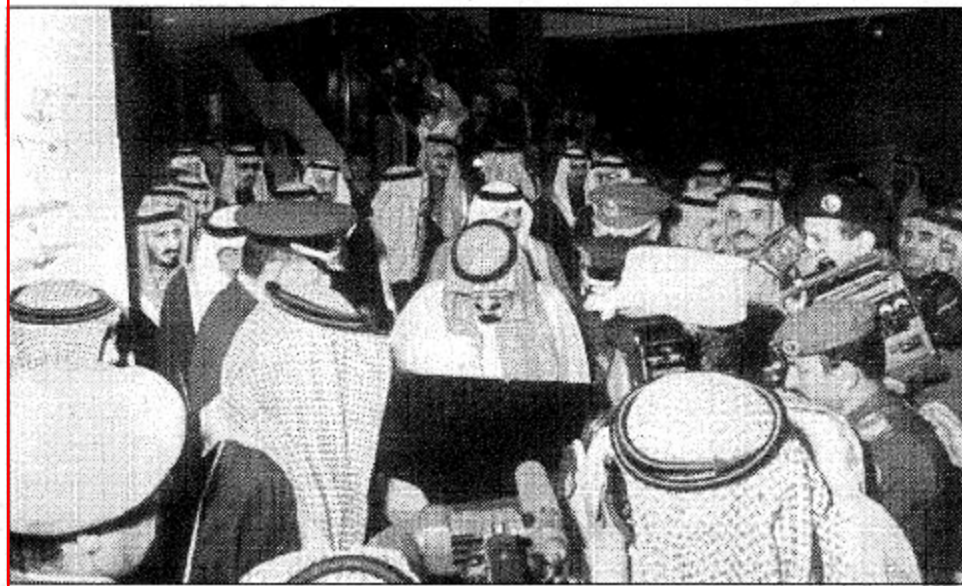
سمو الأمير عبد الله يطلع على محتويات المتحف