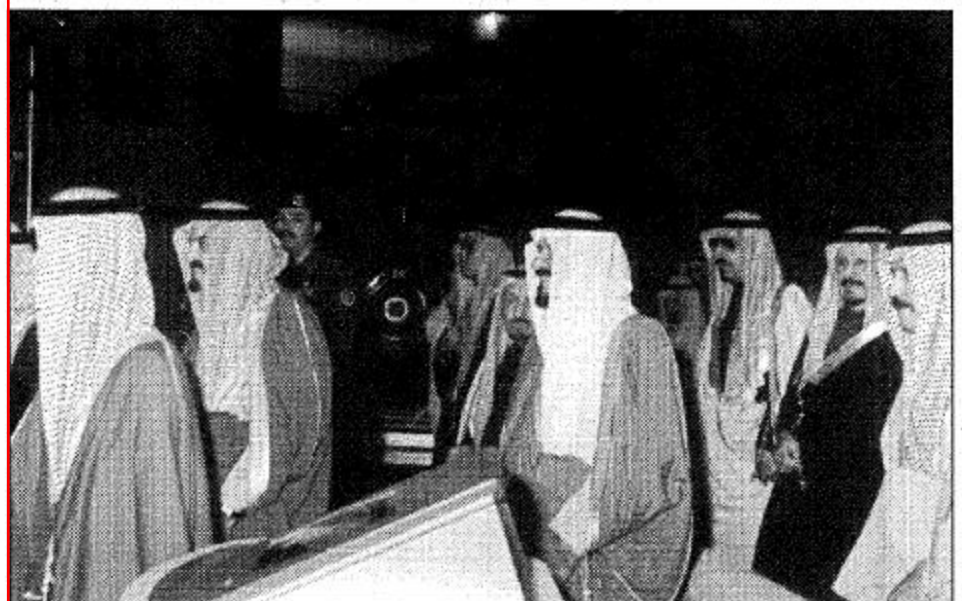
الأمير مشعل والأمير سلطان والأمير عبد الرحمن في جولة