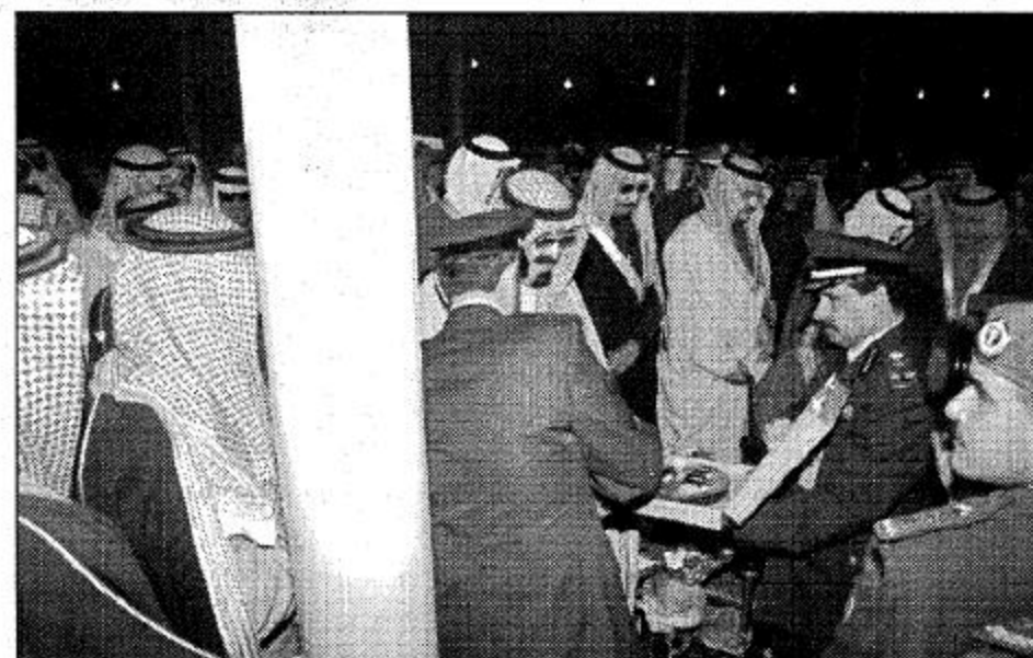
سمو ولي العهد يتسلم درعاً من قائد القوات الجوية