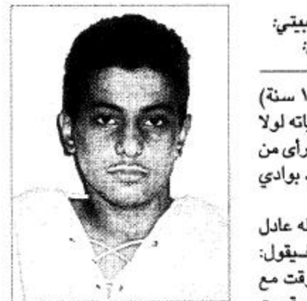
الغدور المساب بلعنات في الظهر

تعرض صبي (١٥ سنة) لطعنات كادت تؤدي بحياة لولا عناية الله ولطفه أمام مرأى من أسرته داخل حديقة العنود بوادي وج في الطائف.