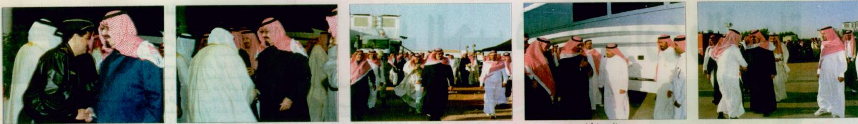
سموه يغادر روضة خريم