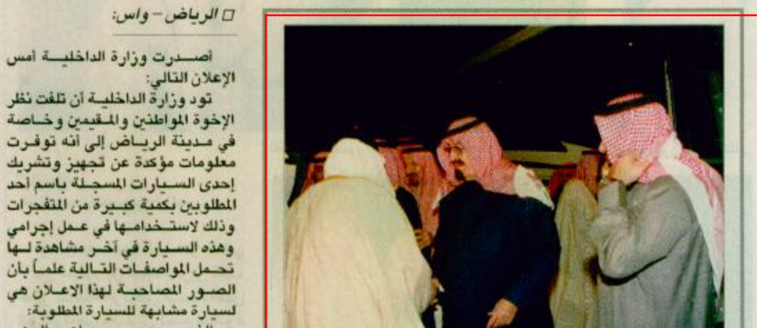
الأمير عبد الله الذي وصله الرياض قادماً من روضة خريم أمس

اصدرت وزارة الداخلية أمس الإعلان التالي: تود وزارة الداخلية أن تلتفت نظر الأخوة المواطنين والمقيمين وخاصة في مدينة الرياض إلى أنه توفرت معلومات مؤكدة عن تجهيز وتشريك إحدى السيارات المسجلة باسم أحد المطلوبين بكيفية كبيرة من المتفجرات وذلك لاستخدامها في عمل إجرامي وهذه السيارة في آخر مشاهدة لها تحمل الموصفات التالية علماً بأن الصور المصاحبة لهذا الإعلان هي لسيارة مشابهة للسيارة المطلوبة: النوع: جمس سوبربان صالون الموديل: ٩١ (ناقل الحركة اتوماتك). رقم اللوحة الأصلية تحمل الرقم (د ن أ ٠٣٤١) مع ملاحظة إمكانية تغيير اللوحة. اللون الداخلي: عنابي - اللون الخارجي: رصاصي غامق وهناك احتمال بتبديله إلى لون آخر الإطارات: جديدة ومن نوع تويو إطارات خاصة بسيارات الجيب. جميع الزجاج مظلل ما عدا الزجاج الأمامي والزجاج الخاص بالسائق والراكب. توجد ستارة خلف المرتبة الأمامية تحجب الرؤية عن بقية المقاعد. جميع المراتب الخلفية منزوعة. توجد علامات احتكاك بجانب السيارة الأيسر. آخر مكان شوهدت فيه هذه السيارة كان حي الربوة بشارع مدينة الرياض. وزارة الداخلية إذ تعلن ذلك لتود من الجميع التنبيه واليقظة حرصاً على سلامتهم وسلامة أسرهم خاصة وأن هذه الفئة الضالة تنزع إلى إخفاء مثل هذه المكونات الخطرة داخل المناطق السكنية. ٤٣ طالع ص