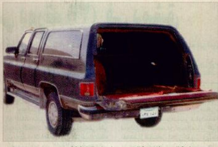
صورة مشابهة للجمس المفخخة التي وزعتها وزارة الداخلية أمس

اصدرت وزارة الداخلية أمس الإعلان التالي: تود وزارة الداخلية أن تلتفت نظر الأخوة المواطنين والمقيمين وخاصة في مدينة الرياض إلى أنه توفرت معلومات مؤكدة عن تجهيز وتشريك إحدى السيارات المسجلة باسم أحد المطلوبين بكيفية كبيرة من المتفجرات وذلك لاستخدامها في عمل إجرامي وهذه السيارة في آخر مشاهدة لها تحمل الموصفات التالية علماً بأن الصور المصاحبة لهذا الإعلان هي لسيارة مشابهة للسيارة المطلوبة: النوع: جمس سوبربان صالون الموديل: ٩١ (ناقل الحركة اتوماتك). رقم اللوحة الأصلية تحمل الرقم (د ن أ ٠٣٤١) مع ملاحظة إمكانية تغيير اللوحة. اللون الداخلي: عنابي - اللون الخارجي: رصاصي غامق وهناك احتمال بتبديله إلى لون آخر الإطارات: جديدة ومن نوع تويو إطارات خاصة بسيارات الجيب. جميع الزجاج مظلل ما عدا الزجاج الأمامي والزجاج الخاص بالسائق والراكب. توجد ستارة خلف المرتبة الأمامية تحجب الرؤية عن بقية المقاعد. جميع المراتب الخلفية منزوعة. توجد علامات احتكاك بجانب السيارة الأيسر. آخر مكان شوهدت فيه هذه السيارة كان حي الربوة بشارع مدينة الرياض. وزارة الداخلية إذ تعلن ذلك لتود من الجميع التنبيه واليقظة حرصاً على سلامتهم وسلامة أسرهم خاصة وأن هذه الفئة الضالة تنزع إلى إخفاء مثل هذه المكونات الخطرة داخل المناطق السكنية. ٤٣ طالع ص