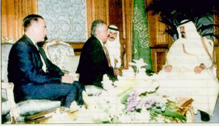
الحرس الوطني رسالة من فضامة رئيس جمهورية المكسيك لارسامو زيدو تتضمن دعوة سموه لزيارة المكسيك. استقبل سموه لهيئة ٢٣