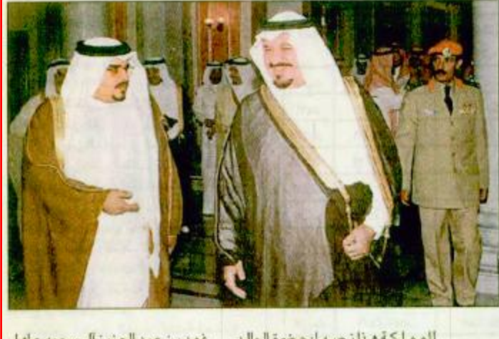
فهد بن عبد العزيز آل سعود عامل للمملكة هنا تصفها، حضرة الوالد العزيز خادم الحرمين الشريفين الملك

جدة، واس، كمالان في رواج سموه نائب رئيس الراسم الكنية منصور محمد الخريجي وأمين محافظة جدة الدكتور نزيه حسن نصيف ومدير عام مطار الملك عبدالعزيز الهنيس سامي مقبول وقائد المنطقة الغربية اللواء الركن صالح الهيمان وفلاح الاسطول الغربي اللواء بحري ركن صالح العجلال. وقد بحث سمو الشيخ سلمان بن حمد آل خليفة ولي العهد والقائد العام لقطر دفاع البحرين برفقة آل خادم الحرمين الشريفين في ختام زيارته