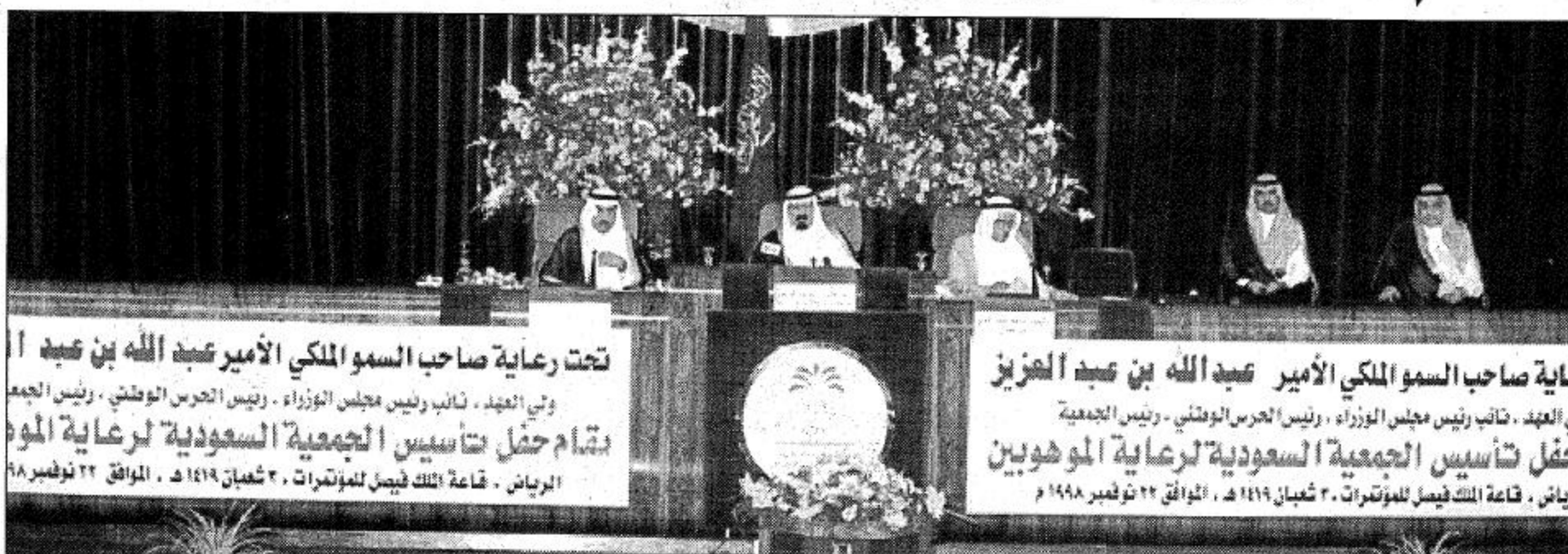
تحت رعاية صاحب السمو الملكي الأمير عبد الله بن عبد العزيز ولي العهد نائب رئيس مجلس الوزراء رئيس الحرس الوطني ورئيس الجمعية التأسيسية للمؤسسة لرعاية الموهوبين - قاعة الملك فيصل للمؤتمرات ٣٠ شعبان ١٤١٩هـ الموافق ٢٢ نوفمبر ١٩٩٨م