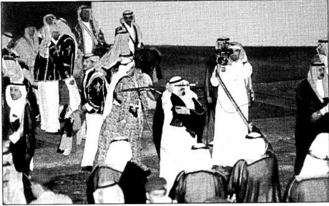
نائب خادم الحرمين الشريفين وأصحاب السمو الملكي الأمراء يشاركون في العرضة السعودية خلال حفل أهالي الطائف □