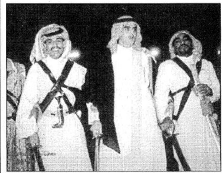
الامير عبد العزيز بن فهد مع فرقة الدرعية

عبدالرحمن بن مطرف من كبار رجال الملك عبدالعزيز الذين شاركوا في معارك توحيد البلاد، وكان هو حامل الراية اثناء المعارك، وكانت له مكانة وحظوة عند الملك عبدالعزيز - رحمه الله - وفي معركة السبلة التي حدثت بين جيش الملك عبدالعزيز والمتمردين عليه من الاخوان اهل عبدالرحمن بن مطرف بلاة حسناً، واصيب وهو يحمل الراية، ثم حملها من بعده عبدالله الشيعبي عاماً كاملاً ثم استمر حاملها الى قبيل وفاة الملك فيصل ياسبوع ثم كلف الملك فيصل بها ابنه مطرف بن عبدالرحمن وتوفي بعد عامين. علماً بان مطرف كان يحمل راية ولي العهد في ذلك الوقت الملك سعود بن عبدالعزيز في جميع غزواته وفي عهد والده الملك عبدالعزيز ثم كلف بحملها عبدالرحمن بن مطرف الثاني ولا زال يحملها، توفي عبدالرحمن بن مطرف الاول في مزرعته بوادي حنيقة المعروف بالباطن. أعماله ونتاجه الفكري: كان يتصف بأنه رجل سياسي مفكر ومحنك ومدبر وشجاع وخصوصاً تصرفاته اثناء خوض المعارك