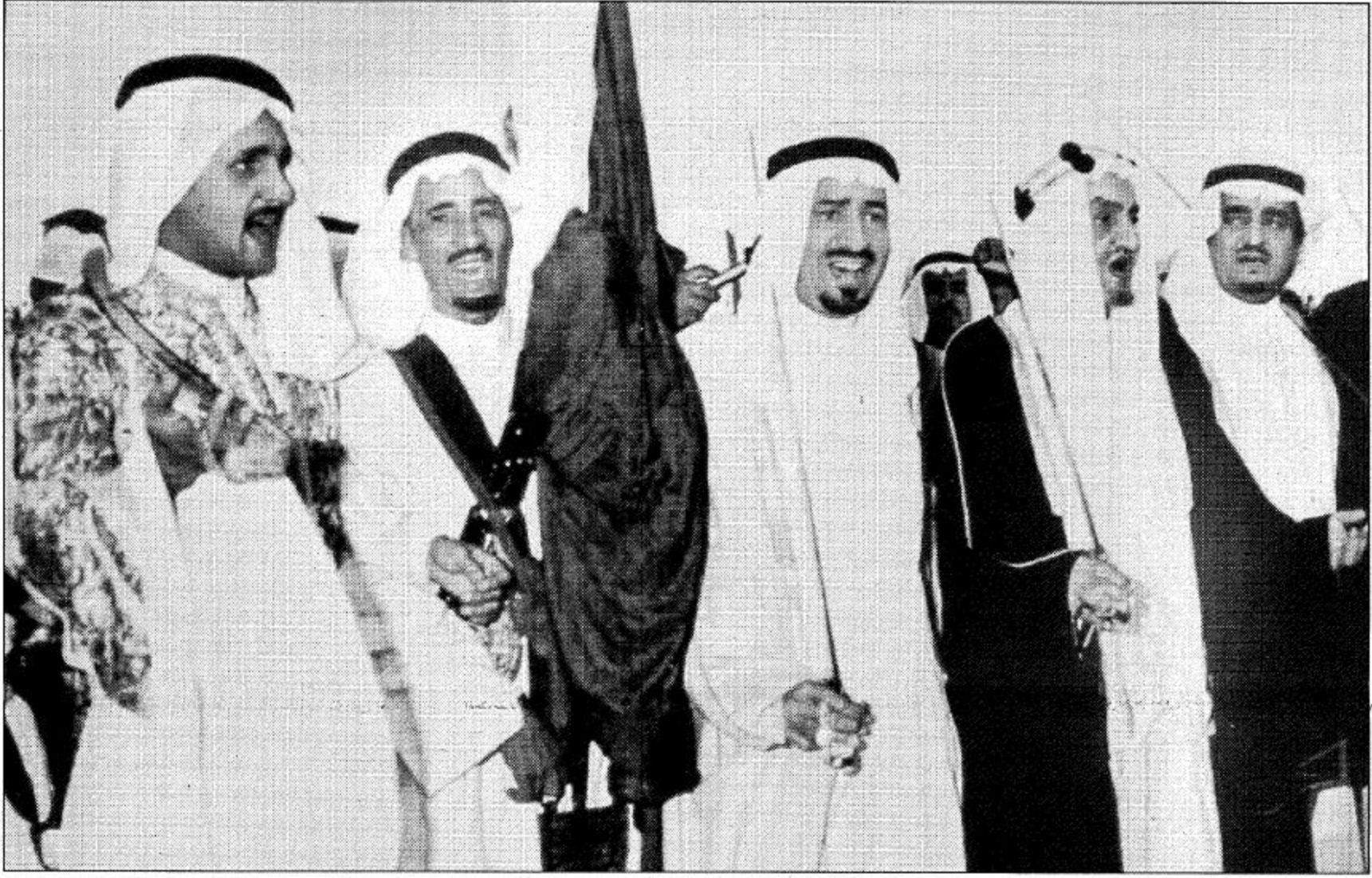
الملك فيصل والملك خالد وخادم الحرمين الشريفين يؤدون العرضة السعودية في إحدى المناسبات

محمد العوني الشاعر محمد بن عبدالله العوني من أشهر شعراء الحروب «العرضة» نشأ في الربيعية، بمنطقة القصيم ومن أشهر الشعراء الشعبيين في الحملة وله قصائد كثيرة ومن أشهر قصائده «مني عليكم يا أهل العوجا سلام» قالها يوم وقعة البكرية ومازالت ترد في المناسبات «العرضة السعودية». يا شيخ باح الصير منسى عليكم يا أهل العرجا سلام واختص أبو تركي عماعين الحبيب يا شيخ باح الصير من طول المقام يا حامي الوندات يا ريف الغريب اضرب على الكايد ولا تسمع كلام العز بالقلطات والراي الصليب لو ان طعت الشور يا بحر القطام ما كان حشيت السدار واشقيت الحبيب اكرم هل العوجا مدابيس الظلام هم درعك الضافي الذي بار الصليب عيتك التي سهرت يعافون المنام غش لغيرك وانت لك مثل الخليب لسي عسكر البارود واحمر القتام وتلافحت بانبالها شهب السبب والله ما يجلي عن الكيد الملام الا الموارت يوم ياتي له نحيب ومصقلات كنهان نوض الغمام بحدودها نفرق حبيب من حبيب