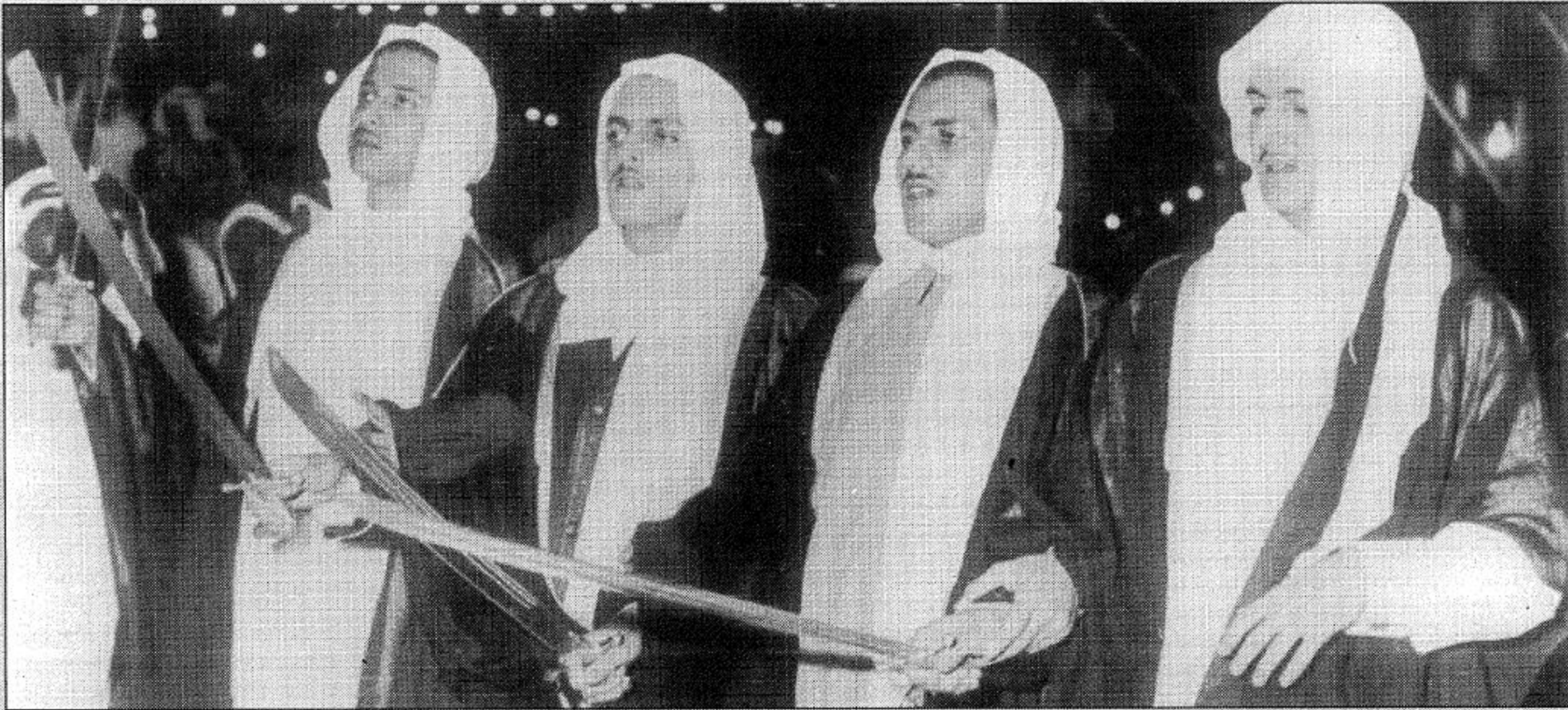
ابناء الملك فيصل بنتر وخالد وسعد ومحمد العبد الله الفيصل في عرضة سعودية بطائف (من الياضي)

من مثل ابوتركي الى ضاقت يسر الحزين يبرى عيون من سهرها مل سهراتها يا صانع الأمجاد وفي قصيدة حربية اخرى تتحدث عن سيرة المؤسس الملك عبدالعزيز آل سعود العطرة قال الشاعر صاحب السمو الملكي الامير خالد الفيصل كعادته هذه القصيدة الرائعة: مناعا على روحك يا ابوتركي سلام لو كان ماتسمع لنا صوت قريب يا عالي الهممات في شد الزحام يا صانع الامجاد يا الشهم النجيب يا جابر المعثرات في جنح الظلام يا ناصر المظلوم يا ملجأ الغريب حلحيل عنده ينتهي كل الكلام سيرة حياته كالهاعطروطيب