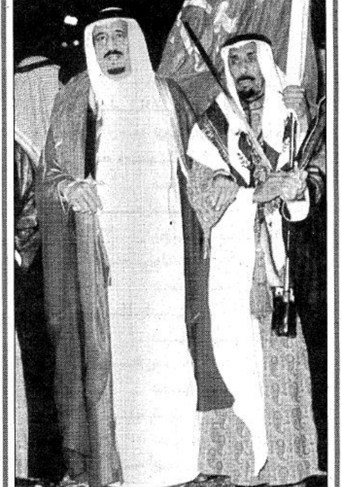
سمو الامير سلمان بن عبد العزيز يشارك في العرضة السعودية