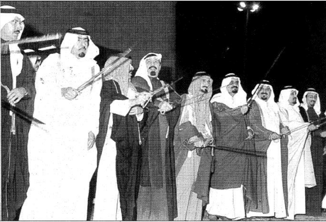
ابناء الملك عبد العزيز من اصحاب السمو الملكي الامراء ومشاركة دائمة في العرضة السعودية