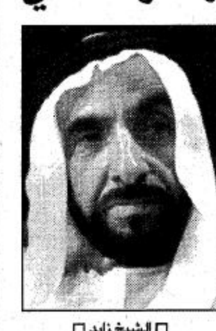
الرياض - واس، تحتفل دولة الإمارات المتحدة اليوم الأربعاء الثاني من ديسمبر بالذكرى السابعة والعشرين لقيام اتحاد الإمارات العربية المتحدة.

وسط نهضة شاملة بجميع المجالات الإمارات تحتفل اليوم بذكرى يومها الوطني