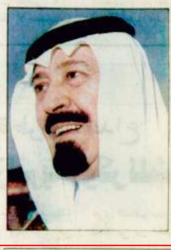
البقية (ص ٢٢)

رئاسة صاحب السمو الملكي الامير عبدالله بن عبدالعزيز ولي العهد نائب رئيس مجلس الوزراء رئيس الحرس الوطني عقد مجلس الوزراء جلسته الاسبوعية بعد ظهر امس الاثنين الرابع والعشرين من شهر ذي القعدة لعام ١٤١٥ هـ في قصر اليمامة بمدينة الرياض. وعقب الجلسة قال معالي وزير الاعلام علي الشاعر لوكالة الانباء السعودية: لقد تابع المجلس توجيه من صاحب السمو الملكي الامير عبدالله بن عبدالعزيز اهتماماته الدائمة براحة الحجاج واستمع الى التقارير المتعلقة بحركة وصول الحجاج والاصحائات الرسمية للاعداد التي وصلت حتى الان الى مطار جدة الدولي. وفي ضوء ذلك اعرب مجلس الوزراء عن ارتياحه وتقديره للخدمة التي يتم بها تنفيذ مراحل الخطة العامة لسيرة الحج هذا العام برئاسة ومتابعة صاحب السمو الملكي الامير نايف بن عبدالعزيز