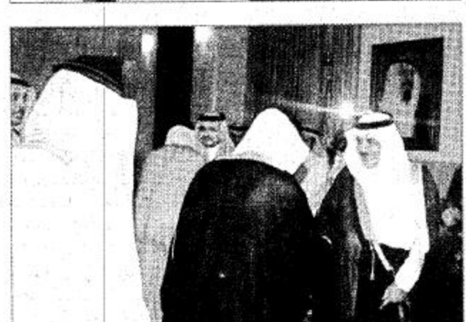
لقطات من الاستقبال