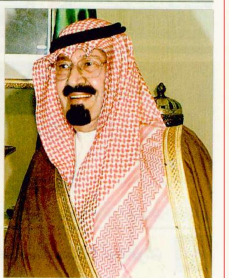
جدة - أحمد سعيد العمري - علي السهيبي

يقتتح نائب خادم الحرمين الشريفين صاحب السمو الملكي الأمير عبدالله بن عبدالعزيز اليوم الثلاثاء موقع الخزن الاستراتيجي بمحافظة جدة. ويقوم موقع الخزن الاستراتيجي بجدة الذي بدأ العمل به في ٢٨ جمادى الأولى ١٤١١هـ بضخ المنتجات البترولية من مصفاة جدة عبر خط أنابيب الامداد الذي يبلغ طوله ٤٣ كم الى كهوف التخزين تحت الجبال. ويأتي موقع جدة في المرتبة الثانية من ناحية تقدم أعمال التنفيذ بعد موقع الرياض. ويقوم الموقع بتأمين احتياجات المنطقة الغربية للمملكة العربية السعودية من المنتجات البترولية وذلك للأغراض المدنية والعسكرية إضافة الى توفير طاقة تخزينية لمساندة نظام توزيع المنتجات البترولية التابع لشركة أرامكو السعودية في المنطقة.