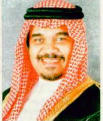
الأمير بندر بن سلطان

الرياض- واشنطن- أس: نشطت الدبلوماسية الأمريكية باتجاه المملكة العربية السعودية لتطبيق تأثيرات الحملة العدائية الموجهة للسعودية من قبل جماعات اليمين المسيحي والقوى الصهيونية في أمريكا، فقد توجه عدد من المسؤولين السياسيين والعسكريين للمملكة وأجروا لقاءات مع كبار المسؤولين السعوديين كان آخرهم مساعد وزير الخارجية الأمريكي والذي تمت زيارته قبل يومين من اللقاء الذي سيقيم بين الرئيس الأمريكي جورج بوش الابن والأمير بندر بن سلطان سفير خادم الحرمين الشريفين الذي سيقيم اليوم في مزرعة الرئيس في كراوفورد بولاية تكساس. وعلى الرغم من عدم كشف البيت الأبيض تفصيلاً عن القضايا المقرر أن يبحثها الرئيس الأمريكي مع سمو الأمير بندر بن سلطان خلال لقاء اليوم يرى عدد من المراقبين أن استقبال بوش للأمير بندر في مزرعته الخاصة التي افتتحت اللقاءات فيها على زعماء الدول