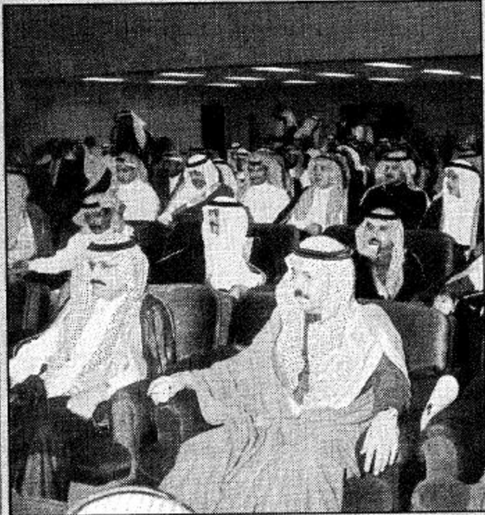
تغطية - حمد الجمهور